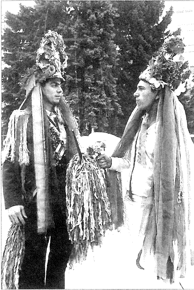
Personaje din reprezentarea teatralizată „Irozii”, Chişinău.