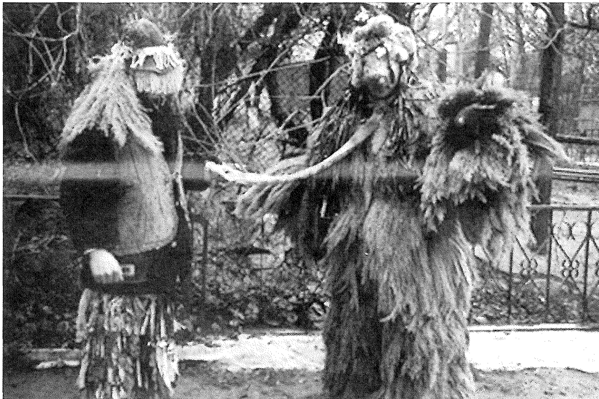
„Bear” of reeds (ritual costume during winter customs). Village of Catranâc, district of Fălești.

V.6. Carolling in mixed group until Epiphany, together with all the practices and representations assigned to it.