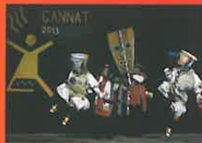
Tijeras (Ayacucho) – Pérou