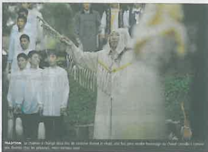
Incantation quand à nos souhaits.

À l'origine, le rite Yasakh, emprunté au peuple yakoute, Sakha, rend hommage à la nature et à sa force. À 6 heures, il commence devant une quarantaine de courageux, encouragés à participer au rituel. Séparés en deux groupes, les femmes d'un côté, les hommes de l'autre se voient d'abord un ruban coloré béni, leur être donné. Pour l'instant aucune explication n'est