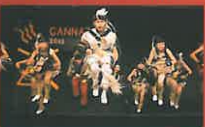
Peuple yakoute Russie