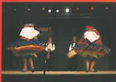
Tisserands de l'Île de Taquile - Pérou

Point d'orgue festif à cette journée, le patrimoine culturel immatériel a rendez-vous avec la planète le temps d'un spectacle à la rencontre de certaines traditions inscrites à l'UNESCO et foulant cette année les pavés gannatois.