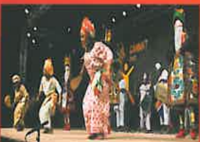
Towara - Bénin