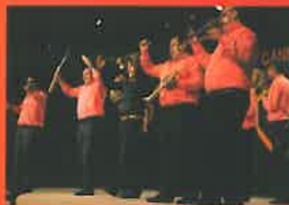
Fanfara Transilvania – Roumanie