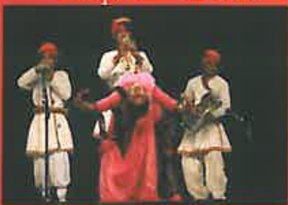
Kawa Brass Band - Inde