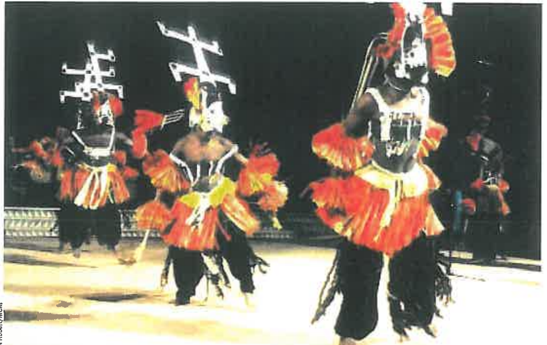
Danses rituelles des Dogon. Ce festival présente un événement rare : un dama, ou sortie de masques de funérailles.

ARWAD ESBER. L'actualité montre tous les jours qu'il importe de continuer à lutter pour préserver cette diversité. Il ne s'agit pas là de tolérance, mais d'accepter que nous ne sommes pas seuls sur la planète et que nul ne peut prétendre détenir la vérité. La culture n'est pas un luxe ni un divertissement. Elle est constitutive de l'Être. C'est par son identité cultu-