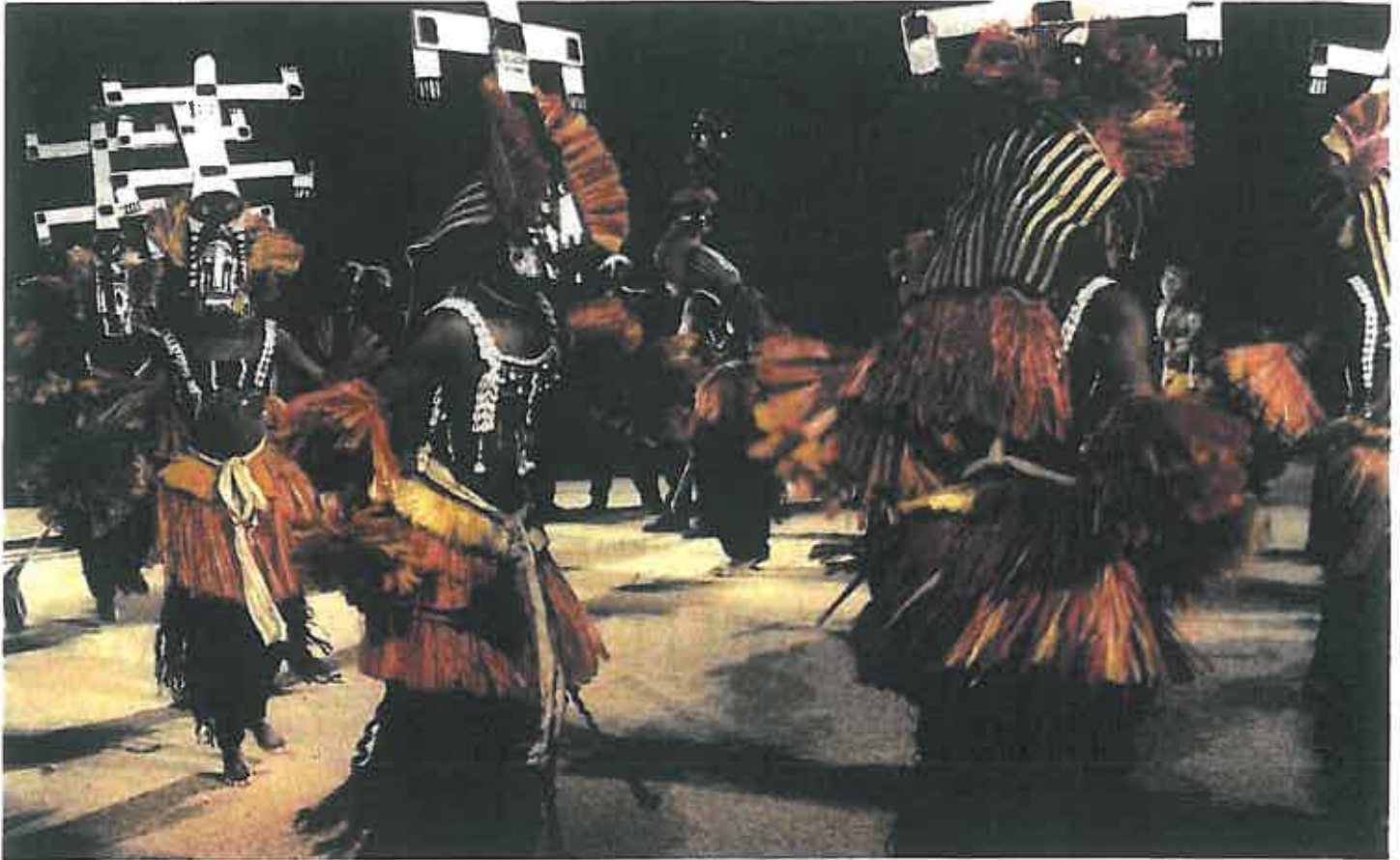
Les Dogons exécuteront du 14 au 16 juin, au musée du Quai-Branly, leurs danses masquées et sur échasses.