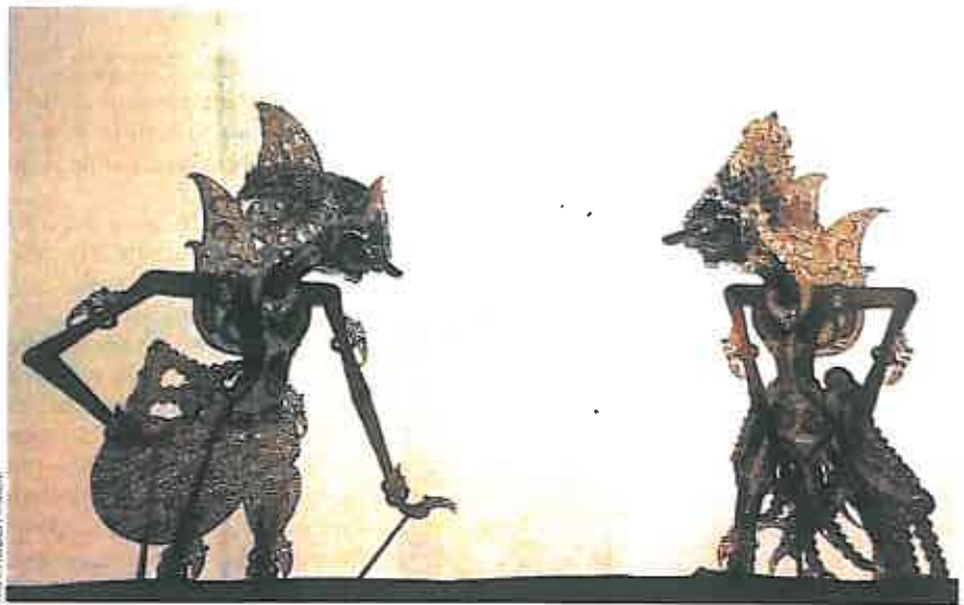
Wayang Kulit , théâtre d'ombres fait de cuir ciselé de l'île de Java (Indonésie).

Pour ouvrir le bal, du 20 au 23 mars, le Théâtre du Soleil accueille sur ses terres du bois de Vincennes, le Wayang Kulit , théâtre d'ombres millénaire de Java où les représentations durent toute la nuit. Faites de cuir ciselé et peint, manipulées à partir d'une tige, les figurines indonésiennes inscrites à l'Unesco en 2008 servent aussi bien à transmettre les enseignements fondamentaux - les grands récits tirés du Mahabharata et du Ramayana - qu'à représenter le monde et commenter son actualité, quitte à railler en donnant son opinion.