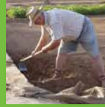
'Ulungaanga Tukufakaholo Fakafonua