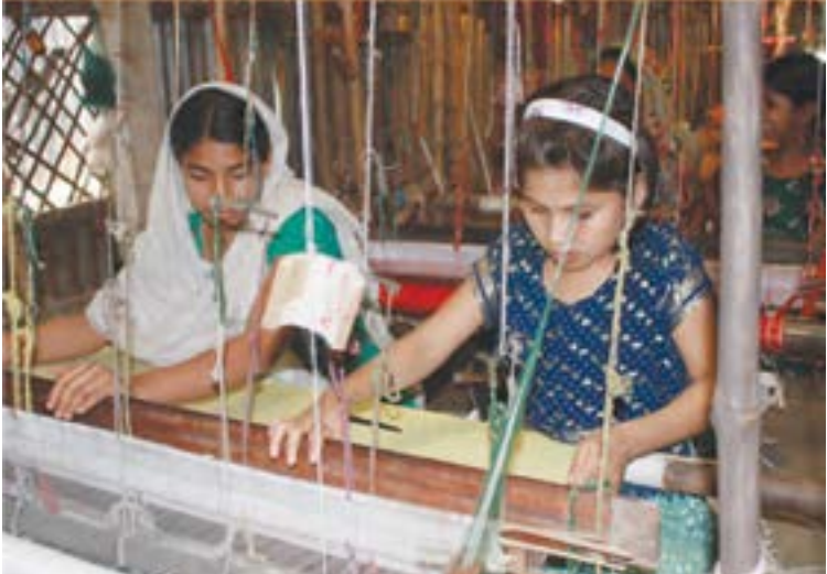
© 2012 by Firoz Mahmud – Photograph: Murshid Anwar

CEDAW དང་དེའི་ གནས་ཁ་ཅན་གྱི་མགོ་སློང་གི་ཡིག་ཚུ་ གིས་ རྒྱབ་རྐྱེན་ཡིག་ཚུ་བཏུབ་མ་ཚན་ སྲིད་བྱས་དེ་མན་རྒྱས་དང་ ལྷན་སྲུང་བཟོ་ནི་དོན་ལཱ་ རྒྱལ་ཁབ་ནང་གི་ཕོ་མོ་འི་མི་སྲུང་ འདུ་མིན་ སྲུང་ཚོགས་དང་འབྲེལ་བའི་ལམ་སྲོལ་ཚུ་ཚུད་དགོས་ཨིན།