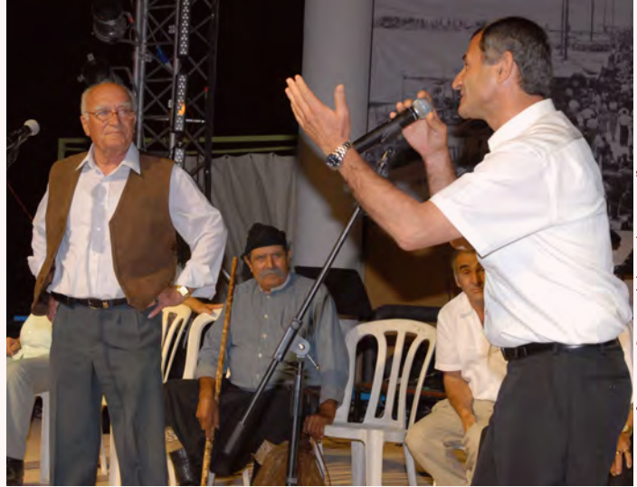
© २००३ लार्नासा नगरपालिका —फोटो: आन्द्रेयास लाकोस