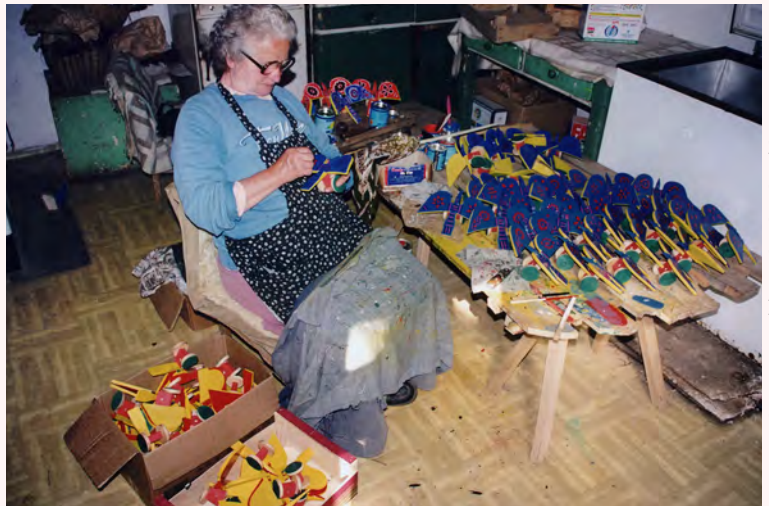
© २००८ संस्कृति मन्त्रालय —फोटो: आइरिस विस्कुपिक बेसिक