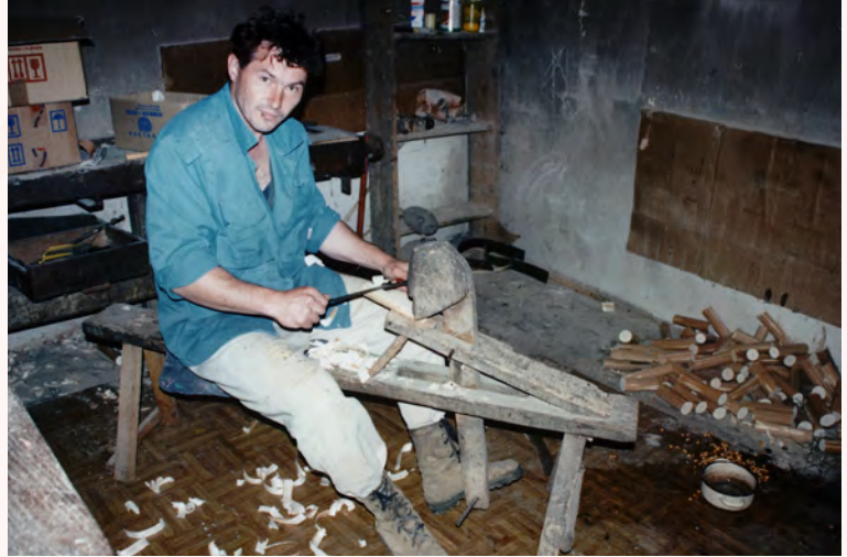
© २००८ संस्कृति मन्त्रालय —फोटो: आइरिस विस्कुपिक बेसिक