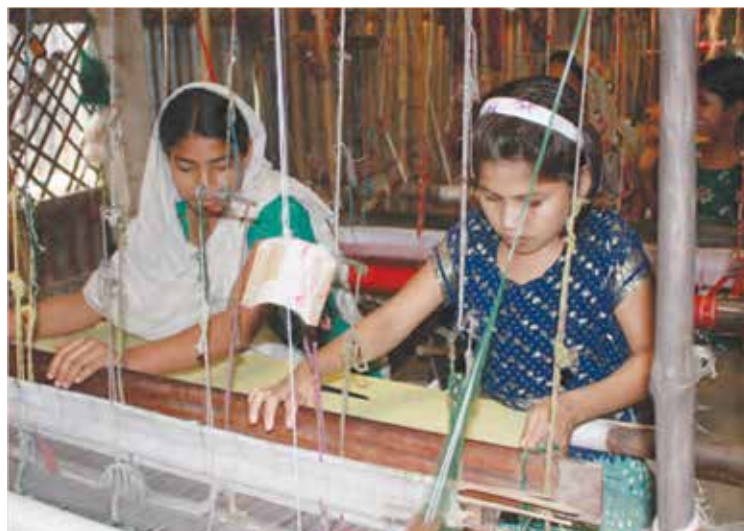
© 2012 by Firoz Mahmud – Photograph: Murshid Anwar

Các văn kiện quốc tế liên quan đến bình đẳng giới, như CEDAW và Nghị định thư không bắt buộc 4 của Công ước này có thể là những tài liệu tham khảo hữu ích. Hơn nữa, để công việc hoạch định chính sách được toàn diện và hiệu quả, cần phải tính đến sự đa dạng của các thực hành liên quan đến giới có trên lãnh thổ của Quốc gia thành viên.