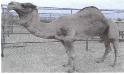
'Shaheen Kleili' camel of Al Ain region, owned by Sheikh Tahnoon bin Mohammed Al Nahyan. It is one of the finest types of bull camels.