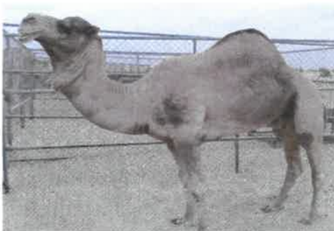
Soghan is known for its short fur and long legs that help it run fast. It is known for starting slow but picking up speed quickly and has long breath and stamina for long races.