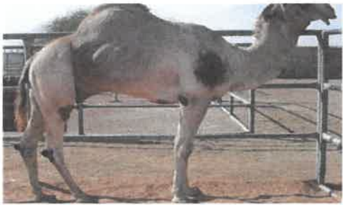
Shaheen Al Mheiri