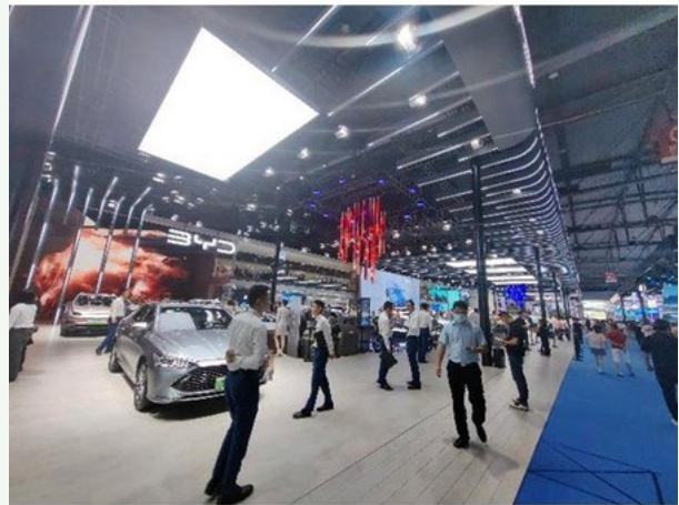
2023 年 8 月に開催された成都モーターショーにおける BYD ブース

そもそも国産化を進める一部例外を除くほとんどの中国 EV は、例えば半導体チップであれば、ディスプレイ等に多用される米クアルコムのスナップドラゴンや、先進運転支援システム (ADAS) 等に多用される米 NVIDIA の Orin に深く依存しており、新車発表時にはクアルコム製、NVIDIA 製のチップを使っている、と強調・喧伝 (けんでん) することも多いほど。中国政府の号令はかかっているかもしれないが、メーカー側もそう簡単に対応できないのが実情だ。それはともかく、同指針のエッセンスを紹介する。