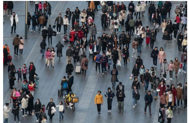
成都市の観光地を歩き交う人々＝四川省（AFP時事）

成都市はジャイアントパンダ関連や伝統分野、美食などに関わる観光業の拡大を図っている。（時事）