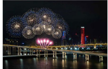
第31回マカオ国際花火コンテストで優勝した 英国チームの花火=11日