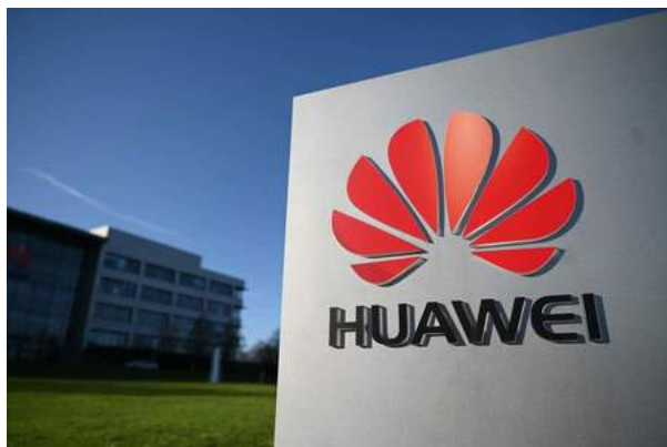
ファーウェイのロゴ（AFP時事）

同社はこれまでに、2024年に商業向けの5.5Gネットワーク機器の発売計画を示し、商品ポートフォリオを拡大する計画を発表している。（香港時事）