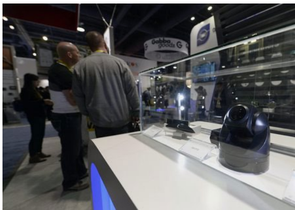
米ラスベガスの見本市に展示された舜宇光学の製品

サプライチェーンに関する最近の調査によると、舜宇のAndroid端末向けカメラモジュール（部品）は最近4～6%値上がりした。主力のスマホ向けレンズに関し、合理的な価格環境維持や新製品の投入により、中高級製品がけん引し、収益に貢献するとみられる。（香港時事）