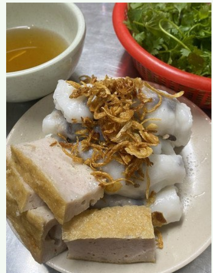
ベトナムの「蒸し春巻き」バインクオン

生地がもちもちしていて食感が良く、一つのサイズが小さいのでおやつ感覚で手軽に食べられるのが良い。何より、店先で一枚一枚手作りしているところが一番のお薦めだ。