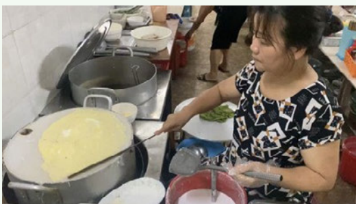
店先でバインクオンを作る女性

【メモ】写真のバインクオンは、地元の人でにぎわう「Banh Cuon Ba Xuan」（バインクオンバースアン）。ホアンキエム湖から北に2キロ程進んだホエナイ通りにある。ベトナムハムのCha lua（チャールア）付きのバインクオン1人前は4万ドン（約245円）。