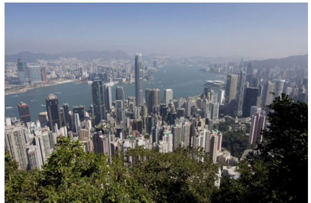
金融街を含む香港中心地区の外観

財務省が6月に発表した当初の計画では、今年香港で4回に分け、それぞれ120億元、60億元、60億元、60億元の計300億元分を発行する予定だった。(香港時事)