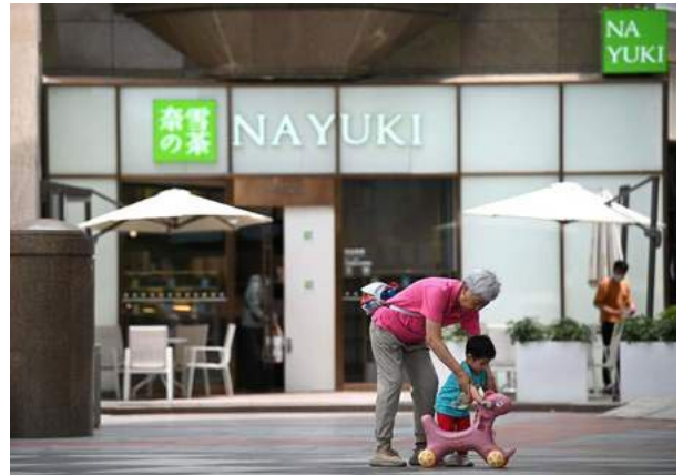
北京の奈雪店舗＝21年6月

奈雪の担当者は「奈雪茶院は同社の茶葉の小売り事業をけん引する主力型店舗となり、将来的には全国展開する予定」と説明した。中秋節と国慶節連休期間に試験運営中だった奈雪茶院の1日当たりの顧客数は3万人を超えたという。（香港時事）