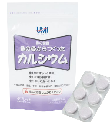
1袋30粒入(約1ヶ月分、1日1粒目安)