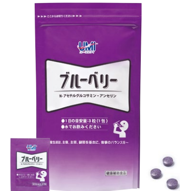
1袋30包入(1包3粒)(約1ヶ月分、1日3粒目安)