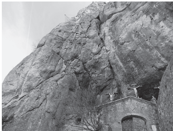
図4 マグダラのマリアの洞窟の聖域入り口

1516年にアルルの司教フェリエの主導により7つの礼拝祠が設置された「王の道」をたどり、標高886mにある洞窟まで、細い道と階段を登っていく。洞窟に近づくにつれて、「静粛」を求める看板、喫煙や肌に見える服装の禁止を指示する看板が置かれており、信仰の場所に入っていくことが感じられる。ドミニコ会が護る聖域の入り口の門は崖の下にあり、ゴルゴダの磔刑場面を表す色鮮やかな群像が並ぶ(図4)。犬が中に入ることは禁止されており、数匹の犬が門の前に待機していた。門をくぐった後、イエスの墓詣での場面を表した群像彫刻が崖下の柵に囲まれた空間に置かれているのが目に入る(図5)。14世紀制作とされるこれらの彫像は、首や腕が破損したままの劣悪な保存状態であったが、マグダラのマリアの洞窟の聖域の中で筆者が目にした最も古い美術作品であった。