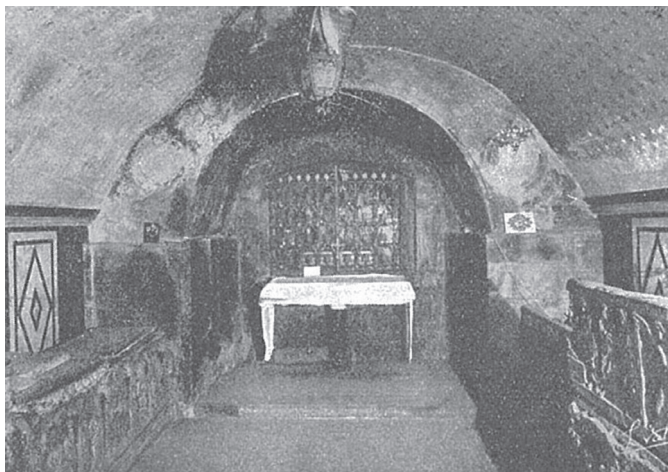
図9 1932年頃のサント=マリー=マドレーヌ聖堂クリプト内部 (R. Doré, « Saint-Maximin », Congrès archéologique de France, 95 e session, Aix-en-Provence et Nice, 1932 , Paris, 1933, p. 214)