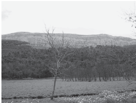
図1 サント＝ボーム山遠景

石灰岩の岩塊であるサント＝ボーム山は東西12kmの長さに広がり、その北斜面は300mから400mの急な岩壁から成る(図1)。山とその周辺には、その地形および歴史が生んだ特殊な