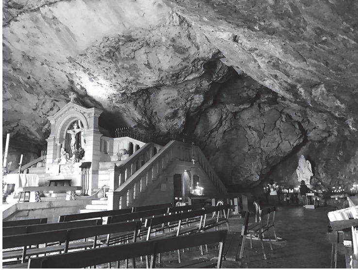
図7 マグダラのマリアの洞窟内部

マグダラのマリアの洞窟の聖域を訪問したのは復活祭後の月曜日であり、休日であったので、それなりの数の訪問客がいた。巡礼を目的とした訪問者よりも、ハイキングを兼ねて訪問する人々の方が圧倒的に多数であるという印象をうけた。外国人観光客の姿は少なく、地元地域の人々を多く見かけた。聖域自体は20年前よりも整備されており、場所の神聖さを尊重することを促す看板が増えていた。