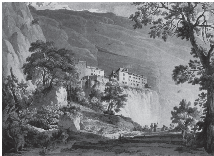
図3 アントワーヌ・ムニエ 『夕暮れのサント＝ボームの眺め』 1792年 水彩画

革命時には、フランスのあらゆるキリスト教関係のモニュメントと同様に、略奪と破壊の対象となり、特に1793年および1815年に激しい破壊を受けた。とはいえ、革命後も、いかにこの場所が著名であり、人々を引き付けたのか、サント＝ボーム山についての数多の巡礼記、旅行記、文学作品が証言している（図3）。信仰の場所であり巡礼の地であり、また訪れるべき観光名所でもあった (17) 。おそらく現在でも一部の人々においてはそうであろう。しかし信仰の情熱はやはり現代において希薄となっており、その知名度も地方的なものにとどまっていることは否めない。現在はむしろ、その雄大な自然を楽しむハイキングやピクニックの場所としての魅力によって人々に親しまれている印象が強い。現在のサント＝ボーム山には遊歩道が巡り、サイクリングやハイキングを楽しむ場所として整備されている。