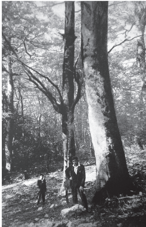
図2 1930年頃のサント＝ボームの国有林の ブナ林

フランス革命後、サント＝ボームの森は国有財産として没収されて国有地となったが、周辺の市町村や宗教団体の反対により、伐採や開発はある程度制限されていた。19世紀になると、社会はさらに世俗化し、宗教的感情からの保護の意識は薄れていったが、一方で自然を賛美し保護しなければいけないという使命感の高まり、あるいは観光資源への活用の観点から、いくつかの団体が森の保護を訴えた。「自然科学的に、歴史的に、そして観光的に」大きな価値のある場所であると保護の必要性が謳われた。しかし、20世紀前半まで、国有地の範囲は限られており、周囲の土地所有者たちは農林地として開発を続け、またマルセイユなどに住む人々の別荘地ともなっていた。1950～60年代になり、国が土地買収を進め、サント＝ボーム山系全体の保護がよ