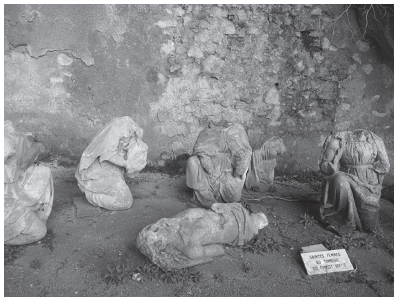
図5 イエスの墓詣での群像彫刻