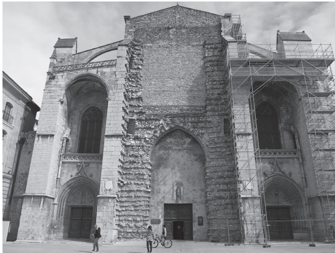
図8 サン=マクシマン、サント=マリー=マドレーヌ聖堂西正面

クリプトとなった墓室は発見時のままに現在まで伝わっているわけではない。たとえば1860年、クリプト内の南部分に祭壇と聖遺物棚を設置するための改修工事が行われた。1884年には石棺が一度取り出され、横の壁が大理石で覆われるが、1932年に取り外される。4体の石棺は少なくともこの時期までは2体ずつ東西の壁に沿い置かれていたが(図9)、現在では、マグダラのマリアの墓に伝統的にアトリビュートされている石棺は、南の聖遺物棚の前に置かれている。