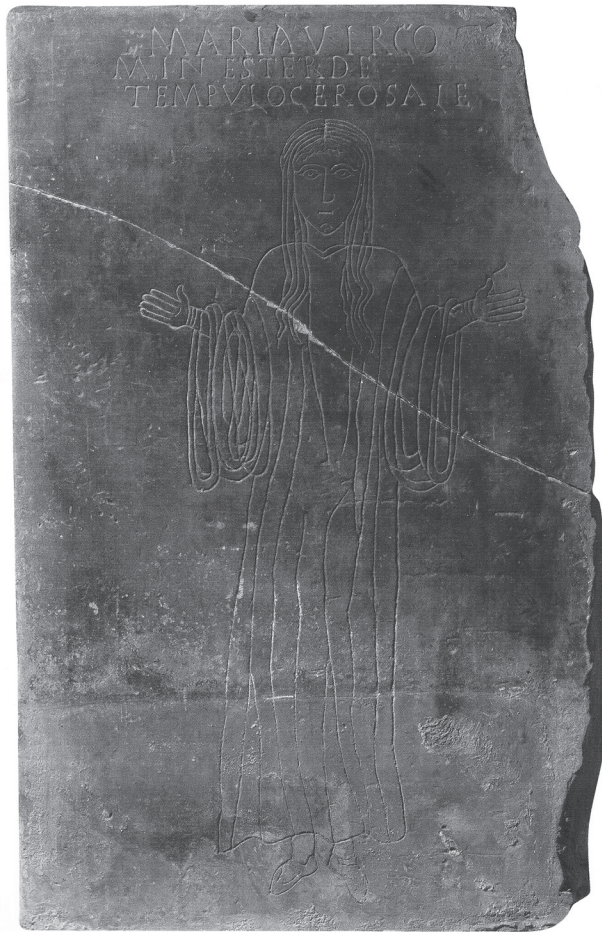
図10 聖母マリアを表す線刻画大理石板（ D'un monde à l'autre. Naissance d'une Chrétienté en Provence IV e -VI e siècle , Arles, 2001, p. 172）

5世紀制作と見なし得る線刻画大理石板が4体、クリプト内に保存されている。そのうちの2体の大理石板（1m20×0m80×0m04）は、それぞれオラント（両手を広げた祈りの姿）の女性を表しており、そのうちの1体は聖母マリアを表している（図10） (19) 。もう1体のオラントの女性像はヴェールを被っており、破損している。他の2体の大理石板（1m05×0m86×0m04）は、それぞれ「アブラハムによるイサクの犠牲」と「ライオンの穴の中のダニエル」を主題とした線刻画が表されている。これらの線刻画大理石板がいつから墓室内にあったのか、もともとの機能は何であったのか、謎は解明されていない。