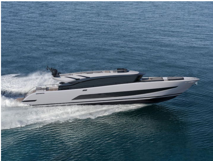
MAN Engines stattet weitere Baureihen von AB Yachts und Maiora mit Motoren im oberen Leistungsbereich aus. Im Bild die brandneue AB110 mit drei Motoren vom Typ MAN V12-2000.

Die neueste Generation an Yachtmotoren von MAN Engines – der MAN V12X-2200 – wird in einer Dreimotorenanlage die AB95 antreiben.