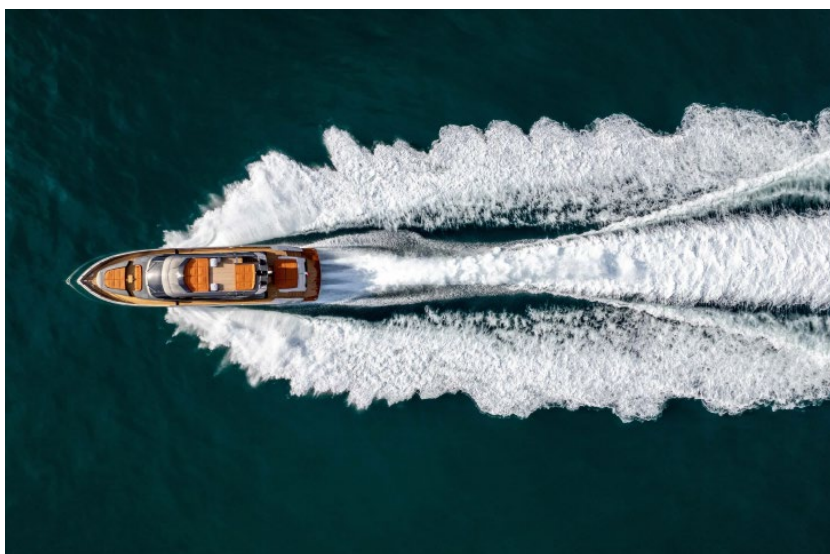
MAN Motoren mit ihrem ausgezeichneten Leistungsgewicht zahlen exakt auf die DNA von AB Yachts und Maiora ein. Im Bild die AB80 mit drei MAN V12-2000.