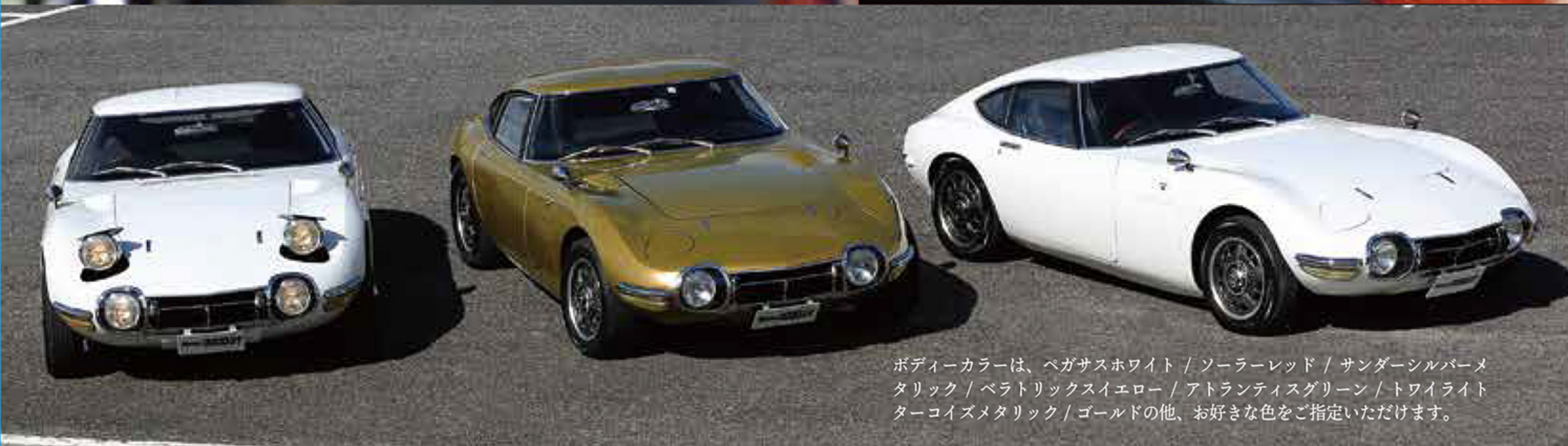
ボディカラーは、ヘガサスホワイト / ソーラーレッド / サンダーシルバータリック / ベラトリックスイエロー / アトランティスグリーン / トワイライトターコイズメタリック / ゴールドの他、お好きな色をご指定いただけます。