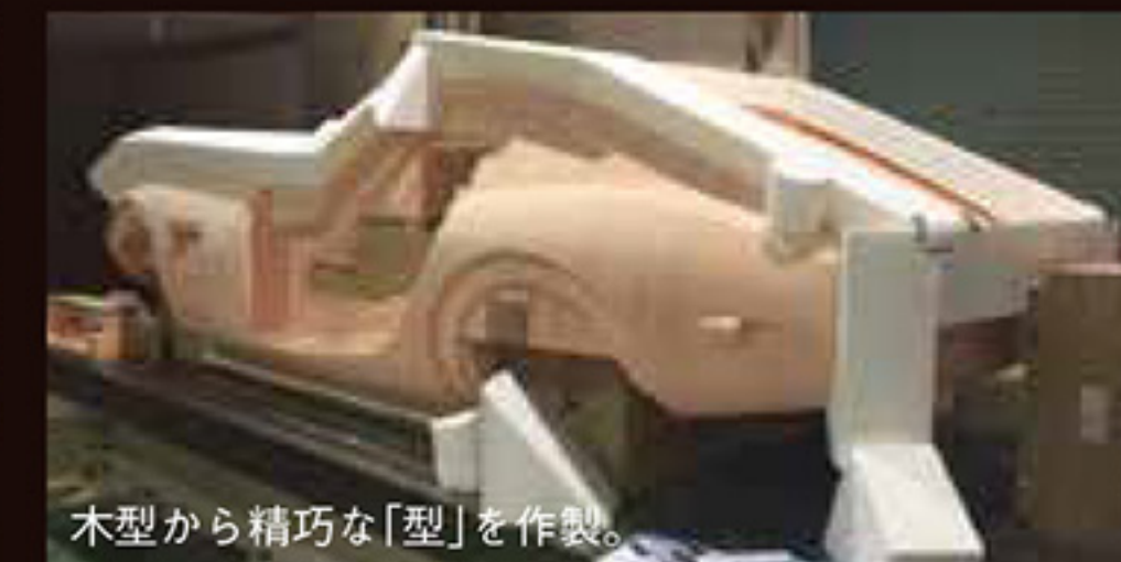
1/1 サイズの木製モック。