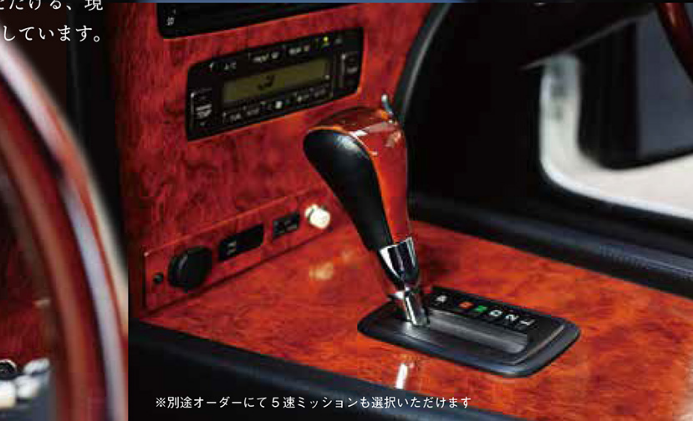
※別途オーダーにて5速ミッションも選択いただけます