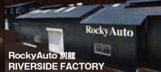
RockyAuto 別館 RIVERSIDE FACTORY