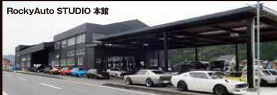
RockyAuto STUDIO 本館

●飛行機の場合……「中部国際空港(セントレア)」から「名鉄空港直行バス」で「名鉄東岡崎駅」まで約1時間です。 ●新幹線の場合……「JR名古屋駅」から「名鉄東岡崎駅」まで約30分です。 ★名鉄東岡崎駅よりタクシー(約15分)で当店へ到着となります