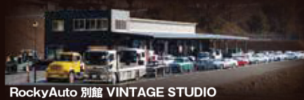
RockyAuto 別館 VINTAGE STUDIO