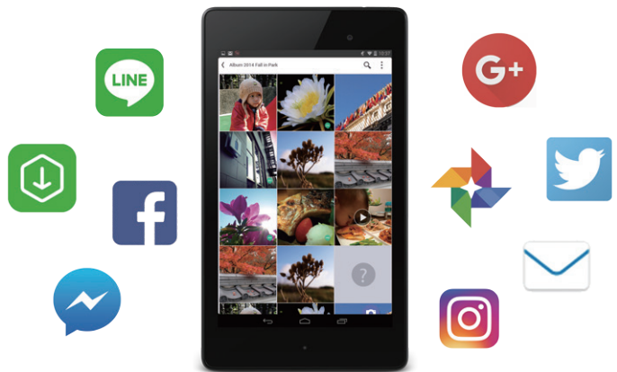
↑ AiFoto 快速分享社群超便利。

社群平台的竄起幾乎改變了人際間的交流模式，人與人不再追求面對面的直接對談，而是轉往相片圖文式的動態分享。因此，利用ASUSTOR NAS的Photo Gallery所打造的專屬相片雲，就可以快速連結存取NAS裡的相片庫，想分享就分享。儘管目前的社群平台種類眾多，AiFoto仍舊可以無縫連接社群平台如Facebook、Line、Twitter、Google+、Instagram等，就算要分享數年前的相片，也是輕而易舉。