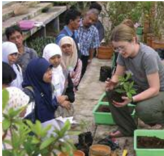
Demonstración de la propagación de Rhododendron en el Jardín Botánico de Cibodas.

adaptación al cultivo y a la hibridación. La gestión de las colecciones ex situ debe pues minimizar el riesgo de pérdida de calidad debido a sucesos accidentales o desastres naturales (derivados de, por ejemplo, cambios de personal, robos, incendios, plagas u otras pérdidas catastróficas), asegurándose de que existan especímenes en varios lugares. Por otro lado, resulta crucial desarrollar una política de supervisión a lo largo del tiempo de las colecciones vivas, para mantener actualizados los vínculos entre los datos de la colección (por ejemplo, su procedencia) y los especímenes.