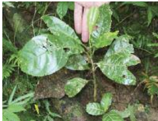
Brinzal silvestre de Magnolia silvioi . (A. Cogollo)

Además de todas estas iniciativas internacionales, el CDB también pide a cada país que desarrolle sus propias Estrategias y Planes de Acción Nacionales en materia de Diversidad Biológica (NBSAP, por sus siglas en inglés). A la altura de octubre de 2010, 171 de los 193 países firmantes del CDB ya habían desarrollado sus propios NBSAP. Ahora se está intentando armonizar estos con los objetivos de la GSPC, así como con los objetivos globales de biodiversidad para 2020. Estos Planes Nacionales suelen incluir requisitos de conservación de especies que constituyen una sólida base para la restauración forestal. Muchos países han desarrollado además políticas y legislaciones adicionales de protección y recuperación de especies que a veces también benefician a las especies arbóreas.