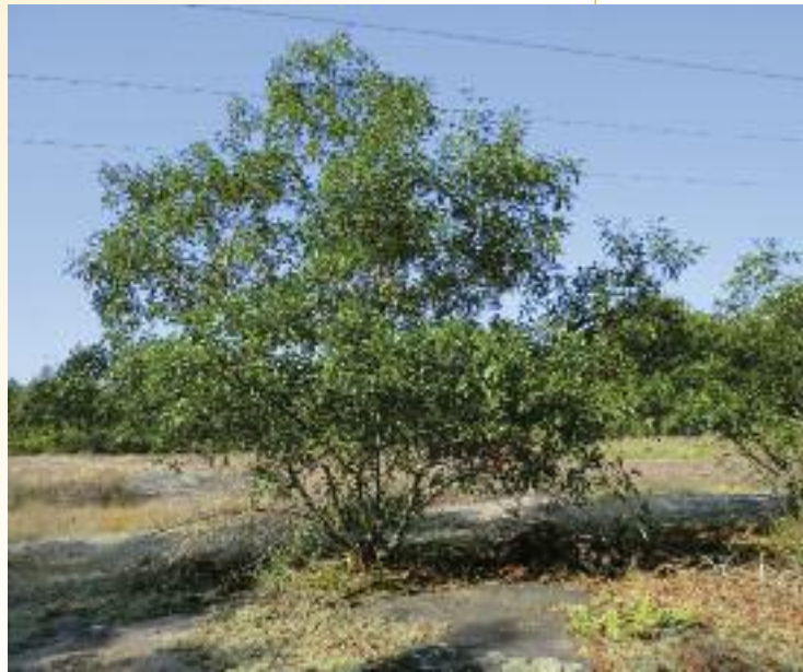
Quercus georgiana . (A. Kramer)

Los miembros del proyecto trabajan con aquellos jardines botánicos y arboretos que mantienen colecciones vivas de estas especies en Estados Unidos, para llevar a cabo estudios genéticos y ensayos de micropropagación. Se ha recurrido a la base de datos de BGCI PlantSearch para localizar dichas colecciones ex situ . Los objetivos del proyecto consisten: