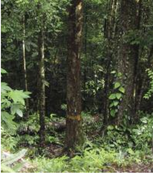
Dipterocarpus sarawakensis. (Wong, W.S.Y)