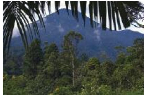
Jardín Botánico de Cibodas y vegetación de sus alrededores (Kemal Jufri)