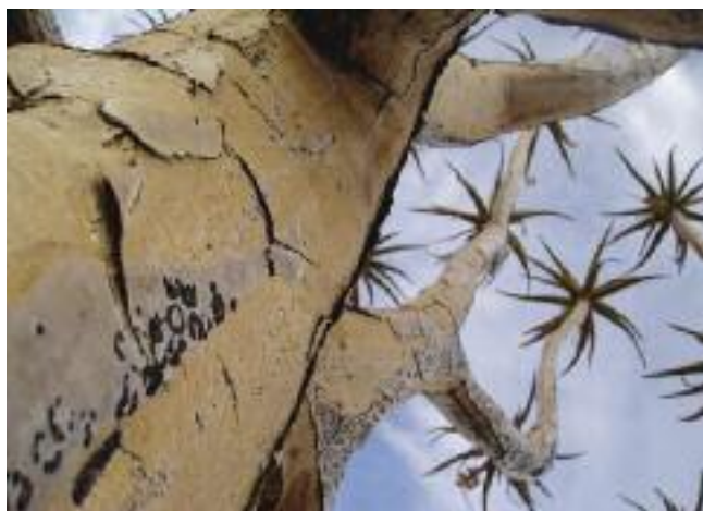
Aloe dichotoma (SANBI)