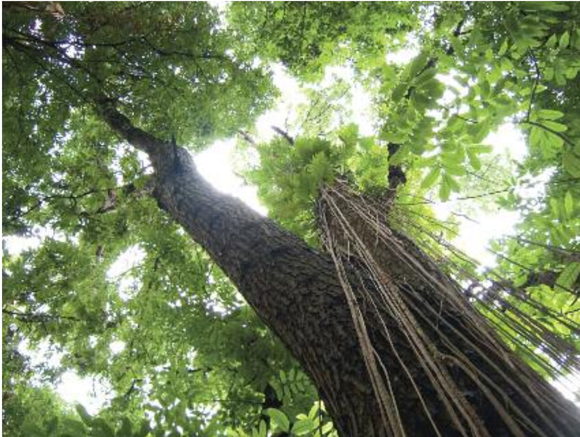
Caoba creciendo en su hábitat natural.

referencia logre suscitar respuestas y estimular este ámbito. El acceso a recursos financieros casi siempre resulta complicado, pero no es menos cierto que la conservación ecológica es una actividad cada vez más reconocida, dentro de la cual la restauración de poblaciones arbóreas y de su biodiversidad constituye un elemento esencial. Por ejemplo, la Global Trees Campaign, una iniciativa conjunta de BGCI y de Fauna & Flora International, tiene como objetivo la conservación de las especies arbóreas más amenazadas a escala global y de sus hábitats. Otra campaña recientemente presentada es la Ecological Restoration Alliance of botanic gardens, coordinada por BGCI, que ha asociado a numerosos jardines botánicos en un plan de restauración de 100 ecosistemas degradados y dañados repartidos por todo el mundo. Por favor, únase a nosotros para compartir sus experiencias y colaborar en la restauración y conservación de los árboles amenazados en todo el planeta.