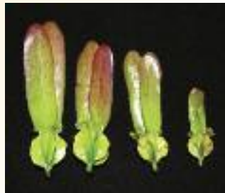
Fruto de Dipterocarpus sarawakensis . (Wong, W.S.Y.)

Actualmente, 264 de un total de unas 500 especies de dipterocarpáceas están registradas en colecciones de jardines botánicos incluidas en la base de datos de BGCI PlantSearch. De estas especies cultivadas, 175 están catalogadas como amenazadas de extinción en todo el mundo de acuerdo con la Lista Roja de la UICN.