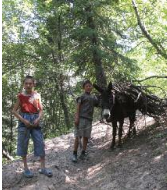
Recolección de leña en el bosque de nogal de Kyrgyzstan.

La conservación integral de especies arbóreas incluiría pues tanto actuaciones in situ como ex situ , relacionadas con la restauración, reintroducción y recolección, para promover su supervivencia. Dicho proceso puede ser respaldado igualmente por iniciativas de investigación, horticultura y educación, para incrementar las posibilidades de éxito de las medidas de conservación (véase la Ilustración 1). Así pues, los jardines botánicos y organizaciones relacionadas pueden llegar a desempeñar un papel importante en la conservación integral de las especies vegetales en todo el planeta, al hallarse en una posición privilegiada para hacerlo (Havens et al. , 2006).