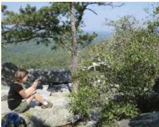
Colección de datos de campo de Quercus georgiana . (A. Kramer)

Para abordar este problema, BGCI de Estados Unidos ha emprendido un proyecto conjunto con el Servicio forestal estadounidense, el parque zoológico de Cincinnati, el jardín botánico del Center for Research of Endangered Wildlife y el programa de posgrado de Longwood, para investigar la conservación de las colecciones vivas actuales de cuatro especies amenazadas de robles. El proyecto incluye también investigaciones para mejorar las opciones de conservación ex situ de las especies objeto de estudio y de otros robles amenazados en todo el mundo. Las especies elegidas han sido: Q. acerifolia (En peligro), Q. arkansana ("Vulnerable"), Q. boyntonii ("Críticamente amenazada") y Q. georgiana ("En peligro"). Entre otros factores de riesgo, la supervivencia de estas especies se ve cada vez más amenazada por una combinación de presiones relacionadas con el cambio climático y con la propagación de la enfermedad conocida como "muerte súbita del roble" ( Phytophthora ramorum ), lo que convierte a las colecciones ex situ en una prioridad esencial en términos de conservación.