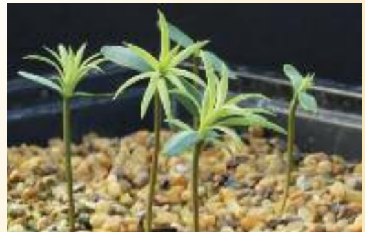
Brinzales de Xanthocyparis vietnamensis . (P. Drury)

Fuente: Dan Luscombe y Matt Parratt, arboreto Bedgebury.