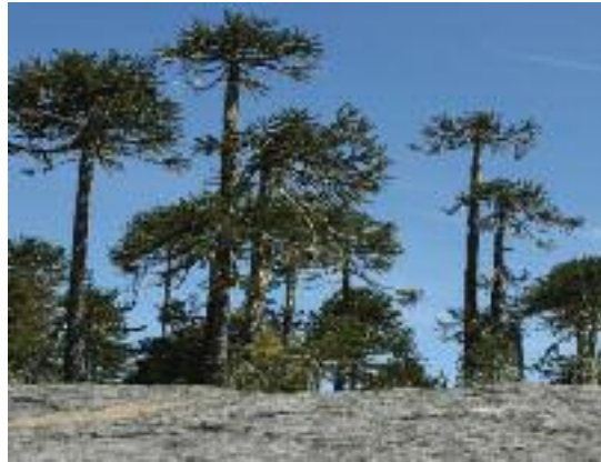
Araucaria en el Parque Nacional Conquillo, Chile

La amplia pérdida y degradación de los bosques primarios ya es reconocida hoy en día como parte de la crisis medioambiental global. Durante el periodo 2000-2005, el área forestal global se ha reducido a un ritmo aproximado de 20 millones de hectáreas anuales (Hansen et al. , 2010), de las cuales hasta 4,2 millones de hectáreas anuales corresponden a bosques primarios (es decir, el 0,4 % de su extensión) (FAO, 2010). La pérdida y degradación de los ecosistemas forestales debido a las actividades humanas constituye una de las principales causas del deterioro global de la biodiversidad (UNEP, 2009; Vié et al. , 2009). Las talas forestales con fines agrícolas, mineros, urbanísticos e industriales también contribuyen a la pérdida de bosques y de especies arbóreas, así como ciertas actividades de explotación forestal, quemas y un excesivo pastoreo, que también pueden tener impacto en la estructura, funciones y