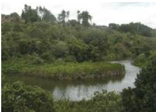
Restauración del bosque en el Jardín Botánico de Brackenhurst, Kenia. (BGCI)

Cuando se recolectan semillas, esquejes, etc. de colecciones ex situ , como los bancos de semillas, hay que asegurar la maximización de la diversidad genética