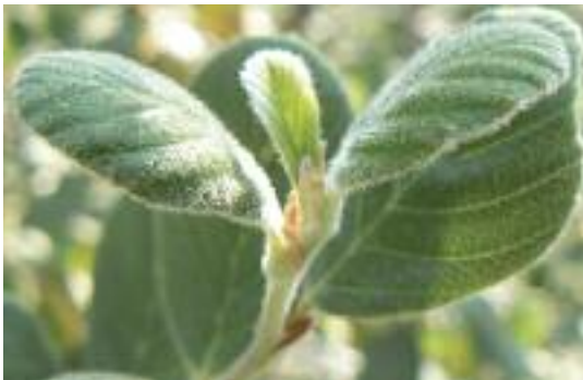
Cercocarpus traskiae . (A. Kramer)