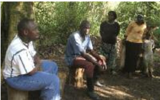
Jardín Botánico de Tooro– involucrando a la comunidad. (BGC)

adecuadamente con las microubicaciones donde van a ser instaladas. Si el objetivo consiste en tratar de imitar las estructuras forestales naturales, entonces la distancia entre los árboles ha de ser irregular y los ejemplares de cada especie deben quedar agrupados.