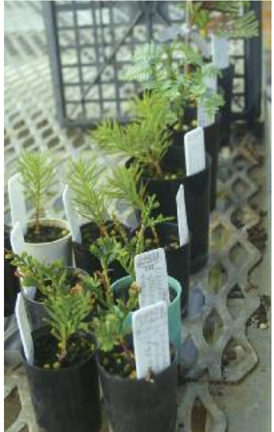
Propagación de coníferas en el Real Jardín Botánico de Tasmania. (RTBG)

Los jardines botánicos han sido uno de los colectivos de usuarios que antes han desarrollado dichas medidas, en el marco del código de conducta de la red internacional de intercambio de plantas (IPEN, por sus siglas en inglés). De hecho, este código está siendo actualmente revisado para adaptarlo al presente Protocolo de Nagoya. BCGI va a procurar compartir toda nueva información al respecto por medio de su página web.