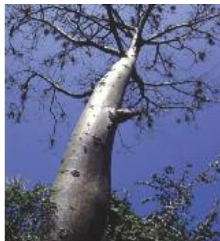
Ceiba trichistandra un árbol del bosque seco tropical amenazado en Ecuador. (BGCI)