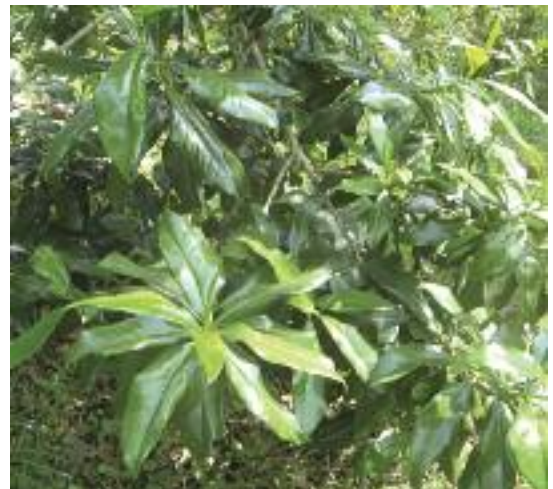
Warburgia – árbol medicinal valorado en África. (BGCI)

Este tipo de planteamientos trata pues de dotarse de una amplia base de información sobre el problema de conservación y de acudir a una variada gama de instrumentos complementarios para perseguir un objetivo determinado (Falk, 1987). Tales planteamientos suelen centrarse muy específicamente en una ubicación concreta y en su contexto local, en contraste con los enfoques más tradicionales, cuyo ámbito de actuación tiende a ser más general. Conviene que los tratamientos sean más individualizados, en la medida en que un mismo instrumento puede tener diferentes efectos según las escalas de actuación; por ejemplo, los bancos de semillas resultan idóneos para conservar la diversidad genética dentro de una misma población, pero no son suficientes para conservar comunidades o ecosistemas completos. A pesar de lo cual, pueden desempeñar su papel dentro de una estrategia integral que pretenda abordar la biodiversidad en múltiples niveles de organización. Así pues, los planteamientos in situ y ex situ no tienen porqué ser independientes o excluyentes, sino al contrario, pueden ser considerados partes de toda una gama de métodos compatibles que se refuerzan mutuamente (Falk, 1987). El propio Falk (1987) nos aporta un ejemplo de gestión por etapas de la protección contra incendios de un ecosistema –como una pradera o una sabana– que incluye: vallado, preparación del lugar, quemadas controladas y