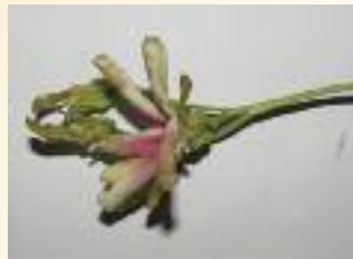
Flor de Dipterocarpus sarawakensis , una especie Críticamente Amenazada en Malasia Peninsular (Wong, W.S.Y.)

La identificación de las diversas especies constituye un problema clave. La incorporación de especies amenazadas depende tanto de los conocimientos taxonómicos especializados, como del suministro de semillas o esquejes de jardines botánicos y arboretos.