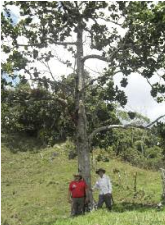
Árbol remanente de Magnolia yarumalensis . (W. Buitrago)