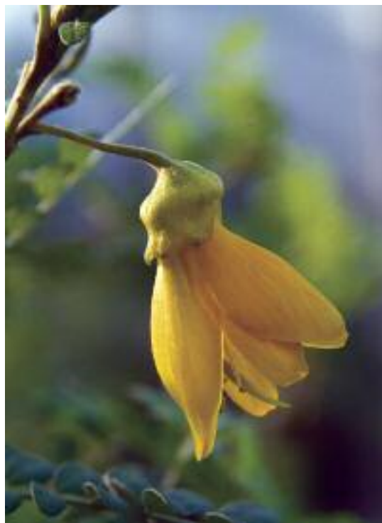
Sophora toromiro. (Magnus Lidén)

Este manual parte de la obra A handbook for botanic gardens on the reintroduction of plants to the wild , publicado por BGCI en 1995 (Akeroyd y Wyse Jackson, 1995) y responde a la creciente urgencia de restaurar y conservar los ecosistemas amenazados. Se basa tanto en obras científicas como en diversas experiencias prácticas de proyectos de conservación de árboles en todo el mundo. Hemos de agradecer pues a una amplia serie de expertos la aportación de sus conocimientos y experiencias, como se reconoce en la página xx. Los siguientes capítulos comienzan explicando brevemente por qué hay que conservar y restaurar las especies arbóreas y cómo desarrollar planteamientos integrados de conservación. Posteriormente se aporta una guía de actuación paso a paso para fomentar el diseño y aplicación práctica de dichos planteamientos. Aunque este manual se limita a ser una breve introducción a un tema muy amplio y complejo, es de esperar que por lo menos sirva para facilitar y fomentar que los jardines botánicos y los organismos de planificación territorial desarrollen actividades integrales de conservación de especies arbóreas.