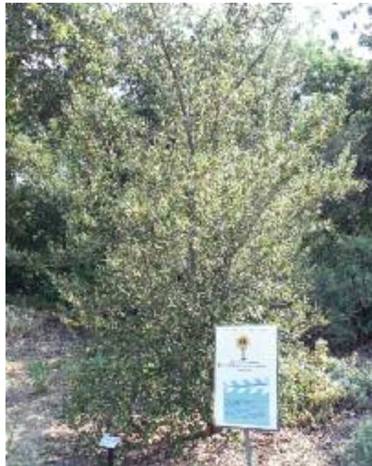
Cercocarpus traskiae en el Jardín Botánico de Rancho Santa Ana. (A. Kramer)

Sociedad de Restauración Ecológica (SER, por sus siglas en inglés). (< http://www.ser.org/ >). Se trata de una organización sin ánimo de lucro con más de 2000 miembros repartidos por todo el mundo, ampliamente reconocida como fuente de referencia experta en técnicas, prácticas y políticas de restauración. Si bien sus objetivos no incluyen la implicación directa en proyectos de restauración, esta Sociedad promueve el diálogo e intercambio de información al respecto, a través de su página web y de la publicación de revistas como Restoration Ecology. También ofrece orientaciones para la gestión de proyectos de restauración en la siguiente dirección de internet: < http://www.ser.org/content/guidelines_ecological_restoration.asp >.