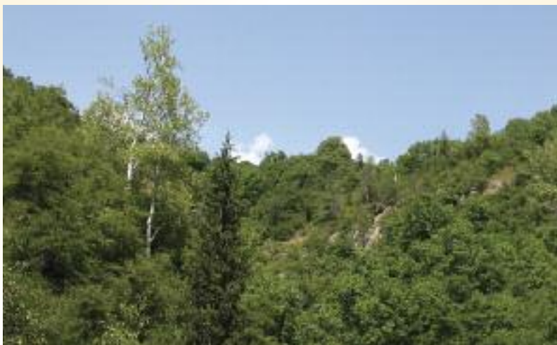
Bosque de nogal en Kirguistán.

Como parte de un proyecto altamente interdisciplinario financiado por el Instituto Darwin de Reino Unido entre 2009 y 2012, BGCI ha estado trabajando con el Jardín Botánico de Gareev, de la Academia nacional de las ciencias de la República de Kirguistán, para desarrollar campañas de divulgación. Estas se centran en la importancia de proteger las especies kirguisas de árboles frutales y de núculas, así como los ecosistemas de los que forman parte. A través de las actividades de Fauna & Flora International y de varios colaboradores kirguisos, se han empezado a hacer esfuerzos para mejorar la conservación ex situ de especies de árboles frutales y de núculas, así como para preparar su potencial reintroducción en áreas silvestres.