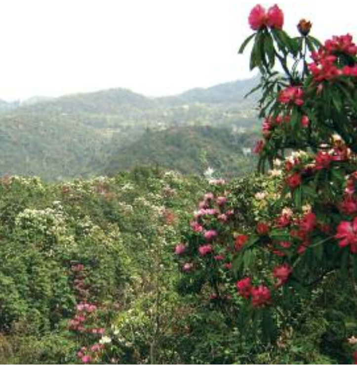
Bosque de Rhododendron en Guizhou, China. (Zhang Lehua)