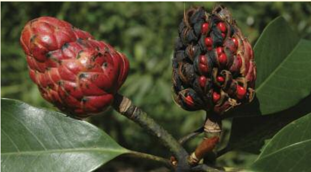
Fruto de Magnolia longipedunculata . (Zeng Qingwen)