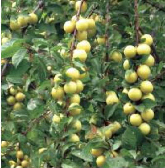
Prunus sogdiana . (BGCI)

establecimiento de los árboles. Esto puede suponer la manipulación de factores como la cobertura vegetal existente, la sombra, los nutrientes disponibles y la presencia de herbívoros. Hay que controlar regularmente el trasplante, para sustituir las plantas que hayan muerto.