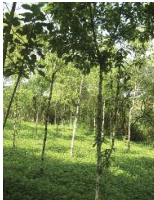
Prunus africana creciendo en el Jardín Botánico de Tooro.