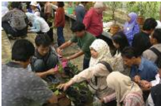
Practicando la propagación de Rhododendron en el Jardín Botánico de Cibodas.

útiles para las evaluaciones de conservación, así como ayudar a identificar especies endémicas regionales y nacionales. Si usted está interesado en llevar a cabo evaluaciones de conservación de especies arbóreas, no dude en contactar con este Grupo de Especialistas en Árboles de la UICN, para obtener información y apoyo.