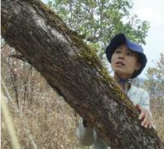
Participación de la comunidad en la conservación de árboles. (BGCI)

aspecto a considerar es que la supervivencia de muchas especies a menudo depende de toda una gama de otras especies, incluyendo entre las mismas a las que favorecen la polinización, la dispersión de semillas o el mantenimiento de un entorno de desarrollo adecuado. Por ello, a veces hay que considerar la reintroducción de especies amenazadas como un simple elemento más dentro de un enfoque más global orientado a la restauración de comunidades ecológicas o ecosistemas completos. A continuación, ofrecemos también información sobre este tipo de planteamientos.