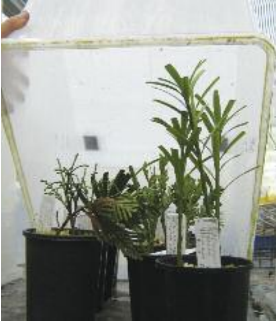
Arriba: Cortes de coníferas en un contenedor cerrado en el Real Jardín Botánico de Tasmania (RTBG).