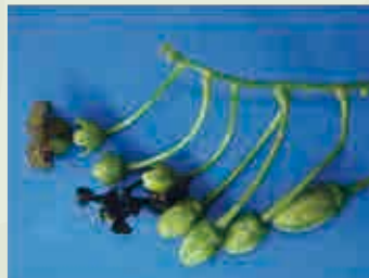
同一花序上非常幼嫩的果实