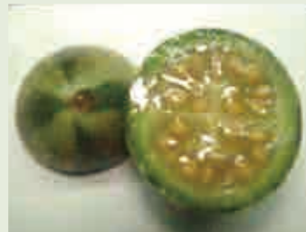
本图展示成熟果实，果肉多汁，黄色，种子发育完全