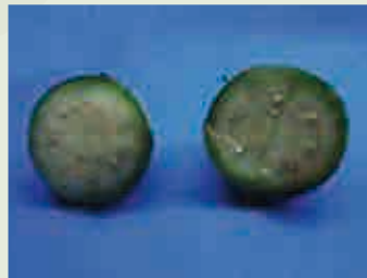
果实横切图可显示成熟果实与未成熟果实间的区别