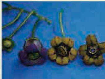
处于不同阶段的花

下图展示了巴西南部一种树番茄属矮小树种Cyphomandra diploconos不同繁殖阶段的照片。