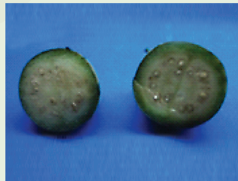
Una sección transversal revela las diferencias entre los frutos maduros e inmaduros de esta especie. En este caso, la carne del fruto inmaduro es dura y blanca, con semillas subdesarrolladas