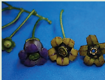
Flores en diferentes etapas de madurez

Fotografías de diferentes etapas reproductivas de la Cyphomandra diploconos , un árbol pequeño del sur de Brasil.