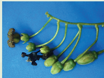
Flores con frutos muy jóvenes en la misma inflorescencia