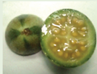
La carne de los frutos maduros de esta especie es jugosa y amarilla, con semillas totalmente desarrolladas, listas para su recolección