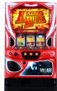
スマスロ『バイオハザード ヴィレッジ』