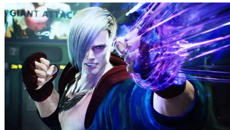
『ストリートファイター6』Year1追加キャラクター 第3弾「エド」が2月に配信予定