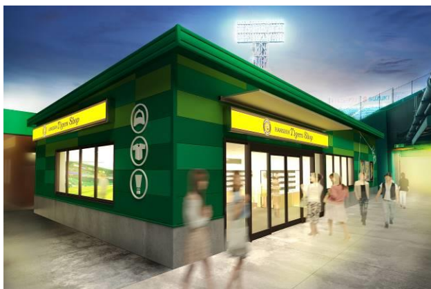
【新グッズショップ】