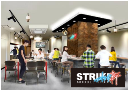
【ストライク軒 NOODLE STUDIO】