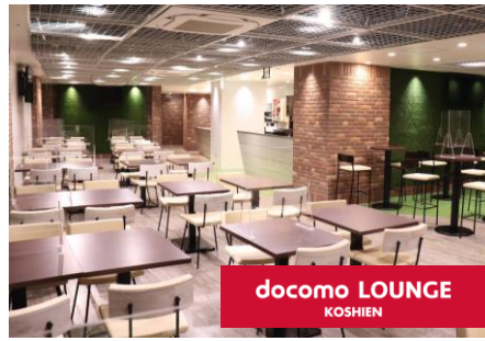
【docomo LOUNGE KOSHIIEN】