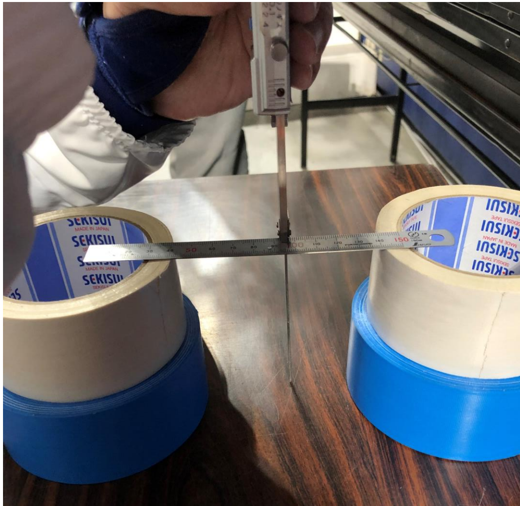
①全体の深さを測る -A