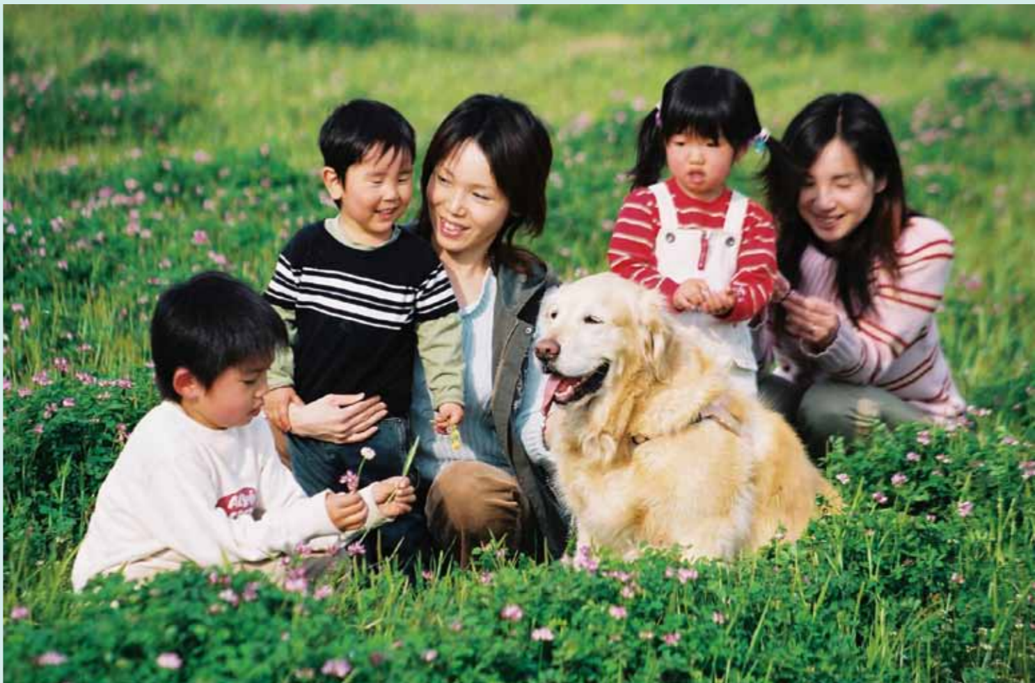
子供たちと犬について 動物の世話をすることは、相手を思いやる心を育み、精神を安定させ、集中力を高めるのに役立つ。