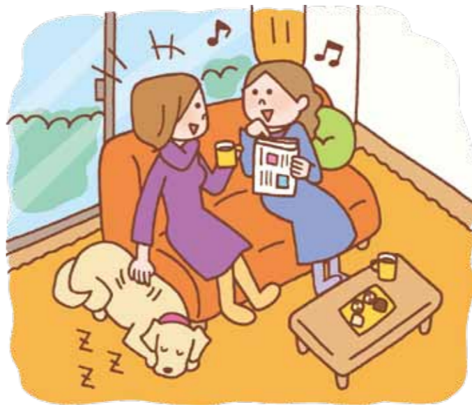
犬と飼い主との理想的な関係は、お互いにストレスがなく一緒にいられること。

犬を飼うとき、多くの人はかわいい犬がいつもそばにいてくれる楽しい生活を想像します。しかし、具体的なイメージを持た