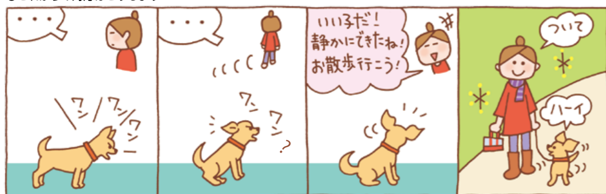
犬が吠えているときは、声をかけたり睨んだりせず完全に無視すること。吠えても飼い主さんから無視されていることに気づくと、犬はやがて吠えるのをやめて静かになる。そのときがほめるチャンス。