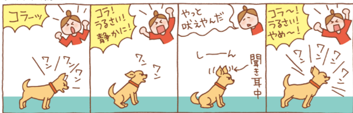
吠えている犬を叱ると、犬は飼い主さんに相手にしてもらっていると思つてよけいに吠えるようになる。