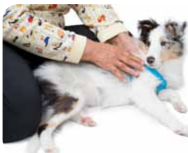
Tタッチ(※)をされてリラックスする犬。

手入れされることが嫌いで咬む場合や、爪切りを手で持つと逃げていってしまうという犬の場合は、怖い経験を重ねた結果ですので、まずは大好きな食事や散歩の時間を利用して、食器、リード、おやつなど犬の好きなものと一緒に爪切りを持って見慣れさせ、手に持つても平気になったら、決して痛い思いをさせないよう慎重に少しずつ、ほめながら短時間でやめるようにして慣らします。飼い主さんとの信頼関係ができれば、いずれは爪切りをさせてくれるようになるでしょう。