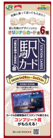
<パンフレットデザイン>