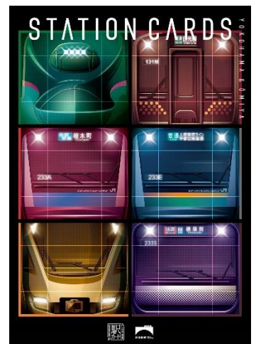
<オリジナルコレクション台紙>