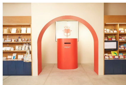
SOZO BOX イメージ

SOZO BOX： https://www.japanpost.jp/pressrelease/jpn/2024/02/20240221_02.pdf