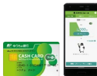
ゆうちょ銀行とモバイル Suica の連携イメージ