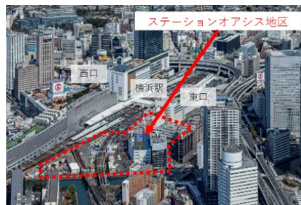
横浜駅東口 ステーションオアシス