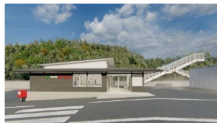
外房線鶴原駅のイメージ

外房線鶴原駅の運営について： https://www.jreast.co.jp/press/2023/chiba/20240221_c01.pdf