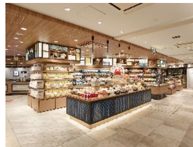
コーナー展開イメージ

また、空き家などを活用した古民家再生を起点とした宿泊事業の展開など新たな地域事業創造などの検討も行っていきます。