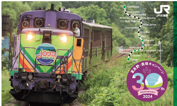
(表) レア感満載のホログラム加工！(キラカード)