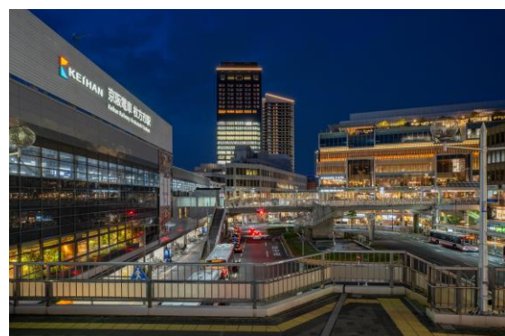
「ステーションヒル枚方」外観