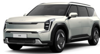
Ivory Silver glossy (ISG) (Disponible uniquement en Earth) (Enkel beschikbaar op Earth)