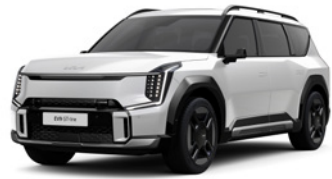
Snow White Pearl (HW2) (De série sur Earth et GT Line) (Standaard op Earth en GT Line)