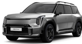
Pebble Gray (DFG)