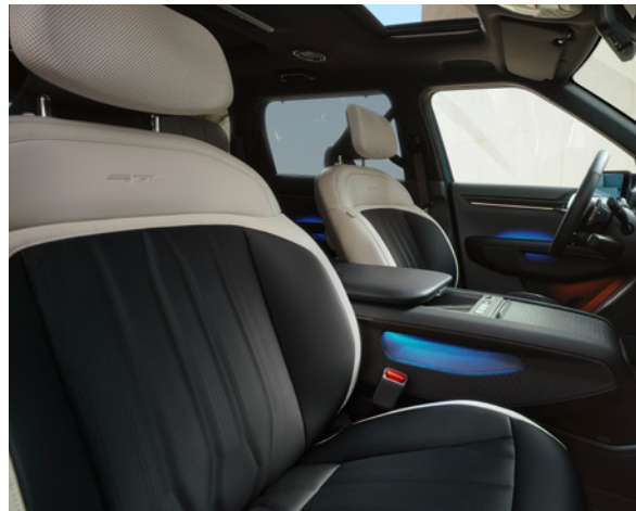
Cuir Vegan - Gris/Noir & Ciel de Toit - Suède - Noir (de série sur GT Line)