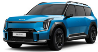
Ocean Blue glossy (OBG) (Disponible uniquement en GT Line) (Enkel beschikbaar op GT Line)