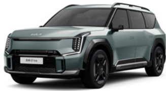
Iceberg Green (IEG)