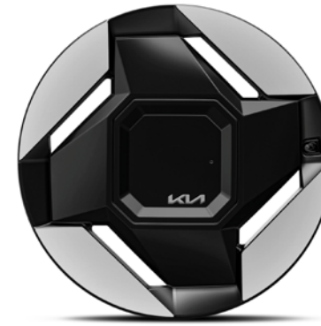
Jantes en alliage 19" avec pneus 255/60 (de série sur Earth)