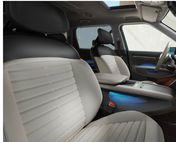
Cuir Vegan Matelassé - Gris Foncé/Gris Clair & Ciel de Toit - Tissu - Gris (option sur Earth)