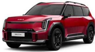
Flare Red (C7R)