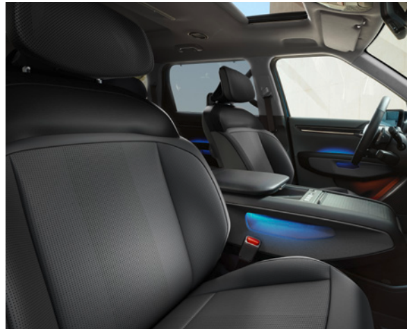
Cuir Vegan - Noir/Gris Foncé & Ciel de Toit - Tissu - Gris (de série sur Earth)