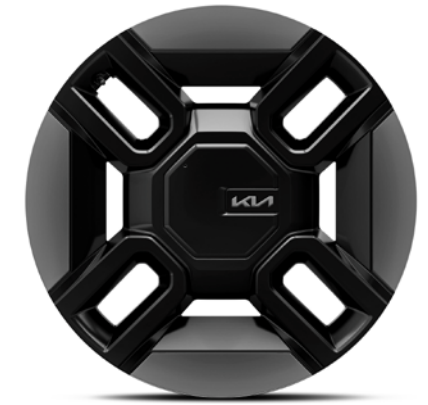
Jantes en alliage 21" avec pneus 285/45 (de série sur GT Line)