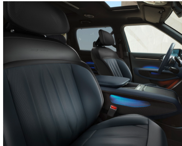
Cuir Vegan - Gris Foncé/Bleu 'Navy' & Ciel de Toit - Suède - Noir (de série sur GT Line)