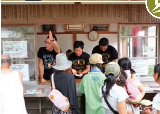
アースセレブレーションでの実地研修。スタッフとして様々な場所でお客様と接する。