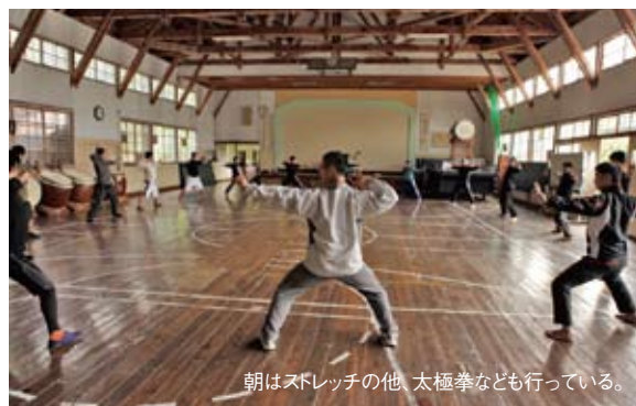
朝はストレッチの他、太極拳なども行っている。