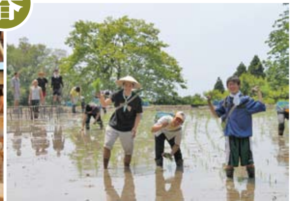
田植え。農作業は、できるだけ自分達の手を使って行う。