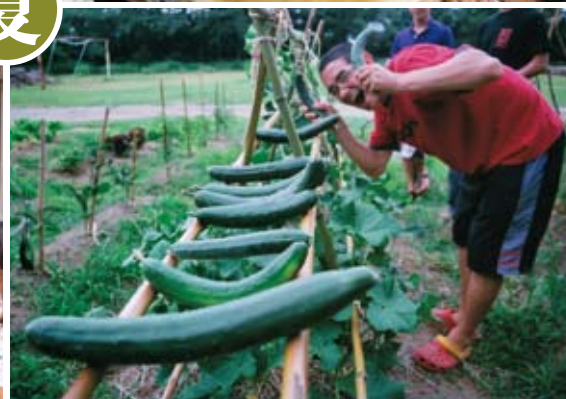
自分達が育ててみたい野菜を、皆で相談しながら作る。水やり、草刈り、そして収穫。