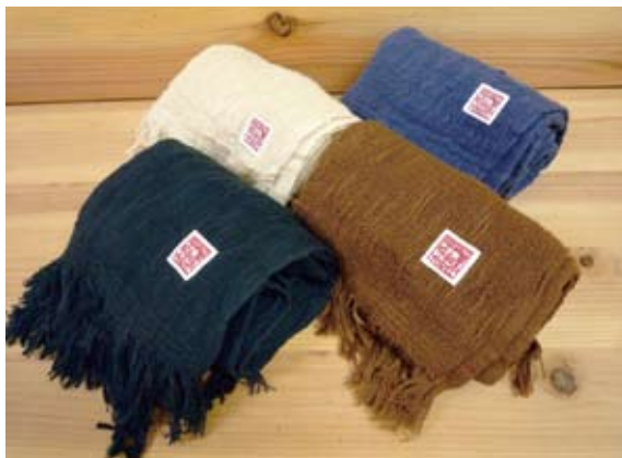
抜群の肌触りが好評です。鼓童「ふわり」タオル