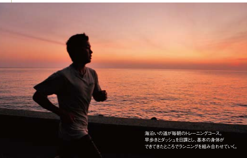
海沿いの道が毎朝のトレーニングコース。早歩きとダッシュを日課とし、基本の身体ができてきたところでランニングを組み合わせていく。