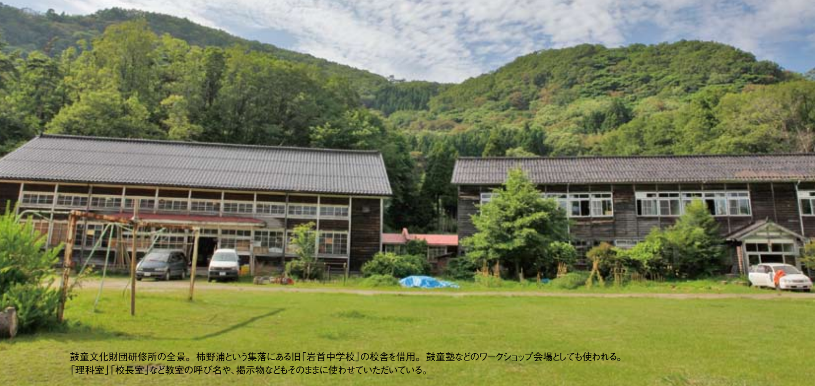
鼓童文化財団研修所の全景。柿野浦という集落にある旧「岩首中学校」の校舎を借用。鼓童塾などのワークショップ会場としても使われる。「理科室」「校長室」など教室の呼び名や、掲示物などもそのままに使わせていただいている。

研修生が日常的に生活し、稽古を行う拠点「鼓童文化財団研修所」。 廃校舎を活用させていただき、地域の方々との交流の場ともなっています。