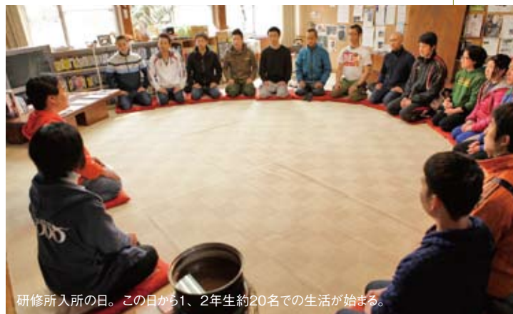
研修所入所の日。この日から1、2年生約20名での生活が始まる。

自分達が育てたお米や野菜を味わう。「いち」をいただくことへの感謝、そして作ってくれた人への感謝の気持ちが生まれる。