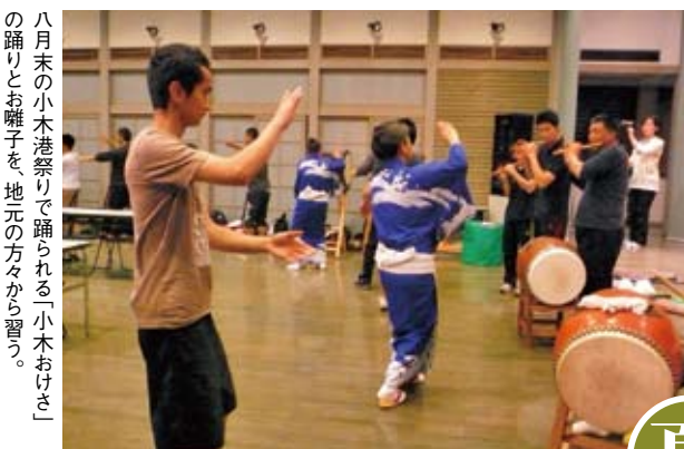
八月末の小木港祭りで踊られる「小木おけさ」の踊りとお囃子を、地元の方々から習う。