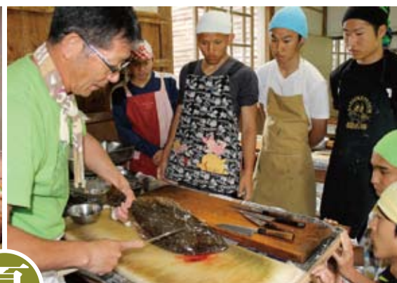
佐渡は周囲を暖流と寒流が交差し、様々な魚がとれる豊かな島。地元の魚屋さんを先生に迎えて、魚のさばき方講座。