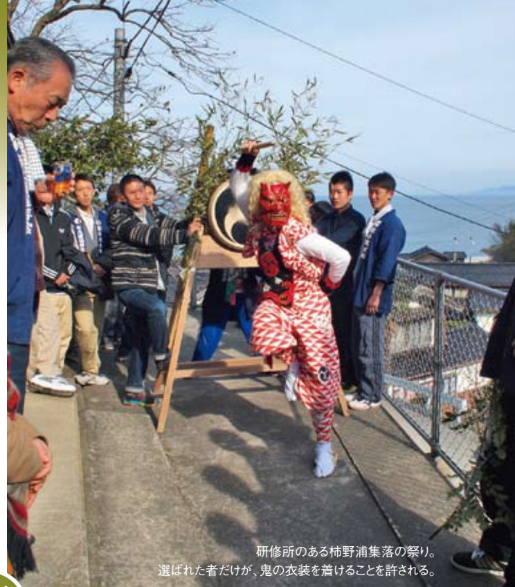
研修所のある柿野浦集落の祭り。選ばれた者だけが、鬼の衣装を着けることを許される。

太鼓、踊り、唄、笛などの稽古に加え、四季折々の農作業や祭り、行事などが研修生の生活を彩ります。