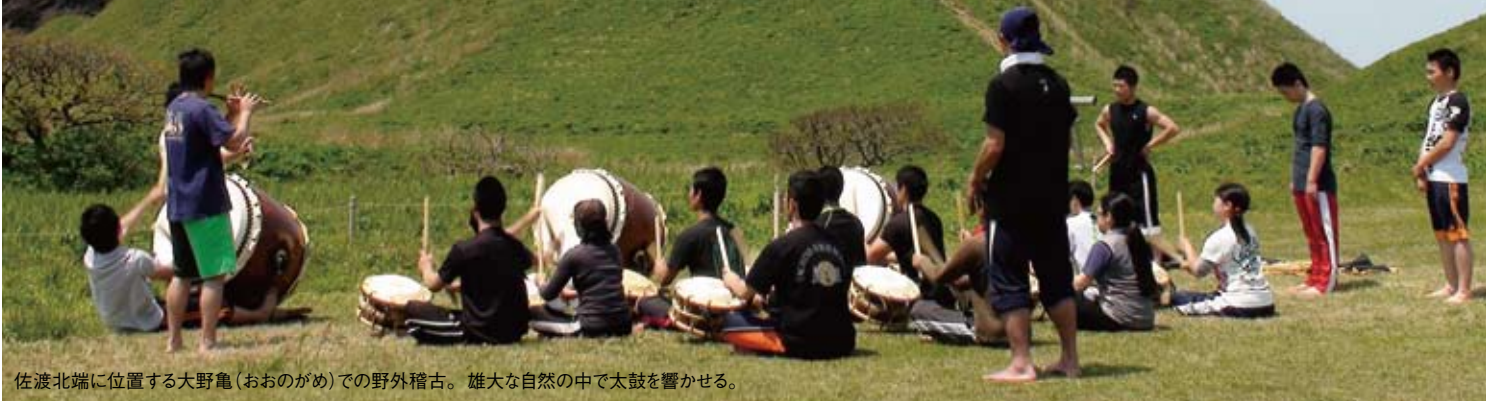
佐渡北端に位置する大野亀(おおのがめ)での野外稽古。雄大な自然の中で太鼓を響かせる。