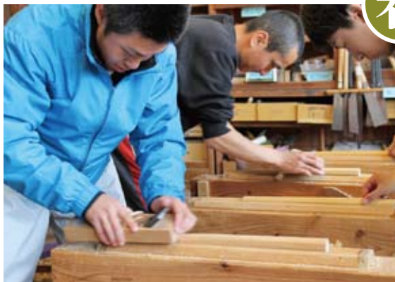
角材を削って、自分の手にあったハチを作る。一日も早く太鼓がたたけますように。