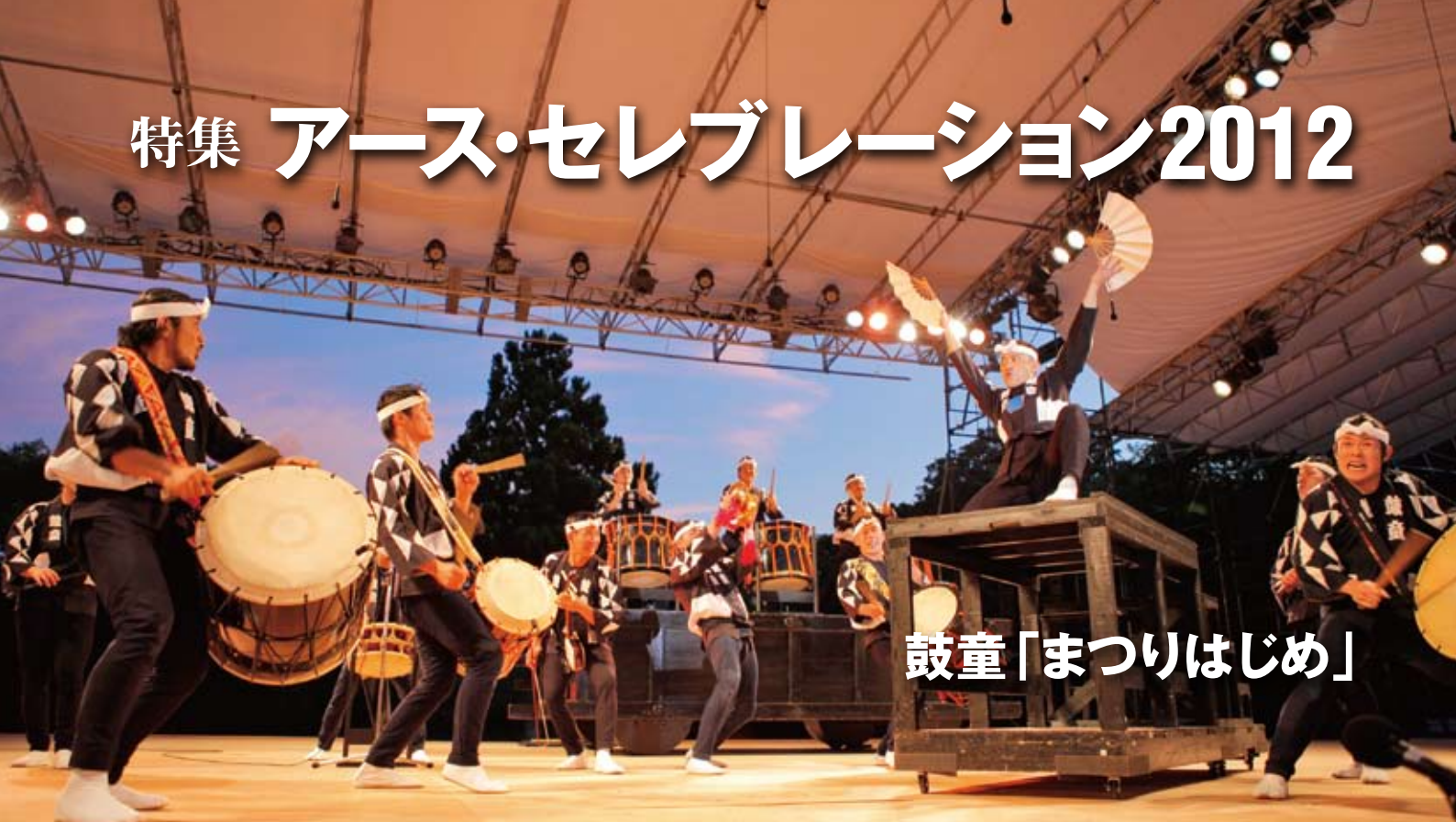
鼓童「まつりはじめ」