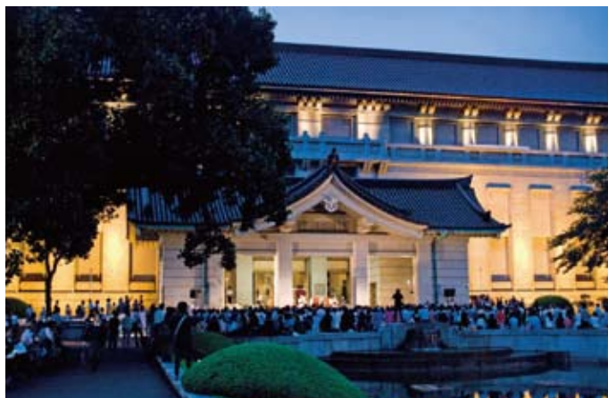
九／二二 東京国立博物館一四〇年記念イベント。