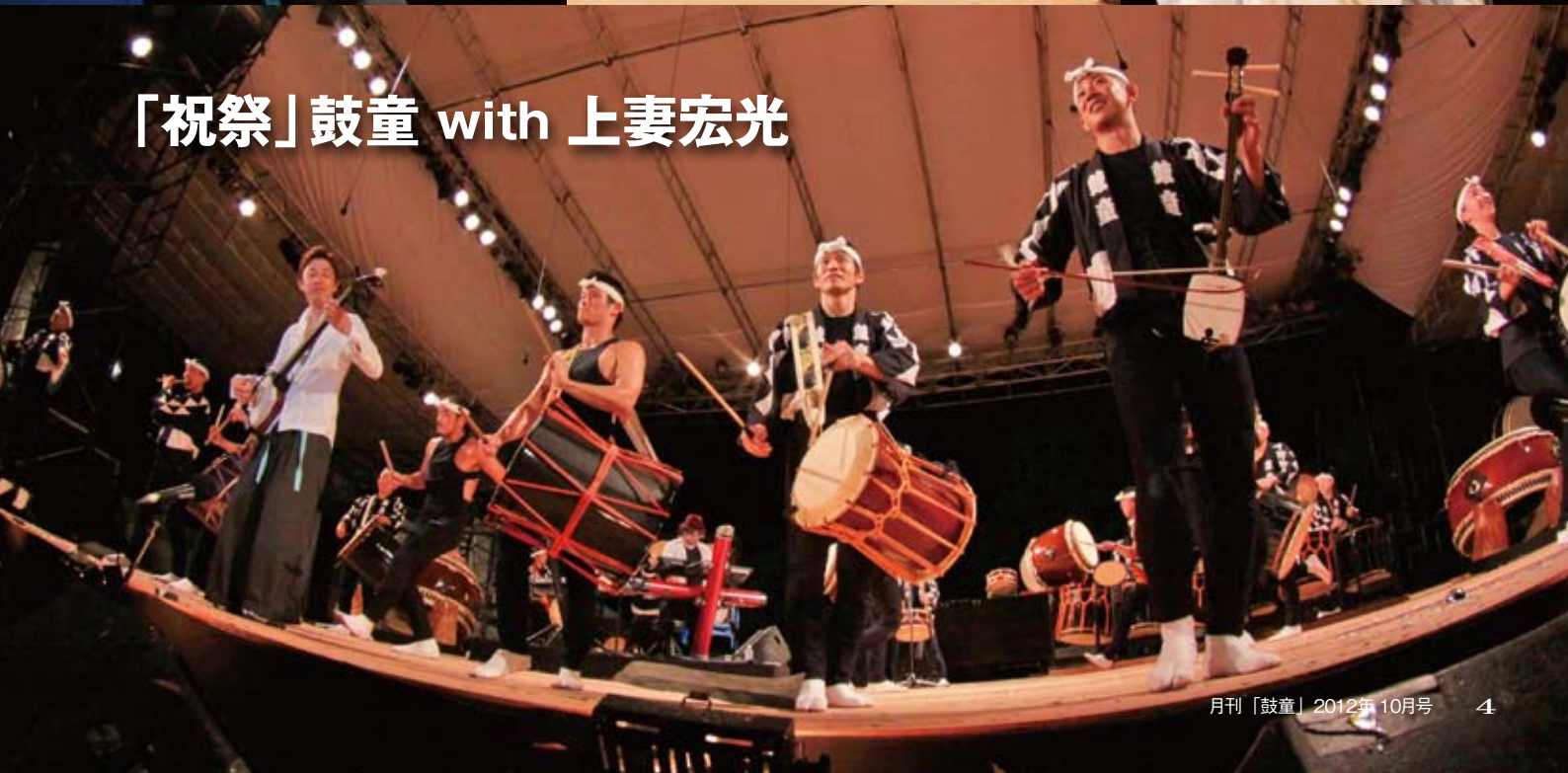
「祝祭」鼓童 with 上妻宏光