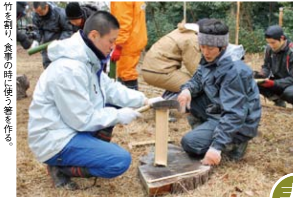
竹を割り、食事の時に使う箸を作る。