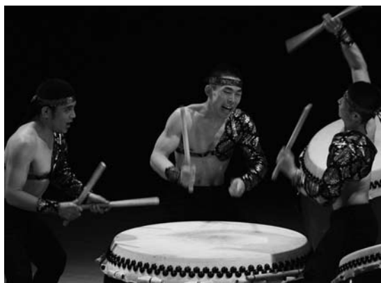
二〇〇六年初演では、八百万の神として「ミカルの」役で出演。

洋介の存在感があつて、僕がその内面を表現できたら、両方で今回のスサノオが成立するのかも… なんて、自分を奮い立たせるために、そう考えています。先に公演するのが洋介なので、いろんな意味で彼は人を惹きつけるので、僕は僕らしいスサノオを、と思っています。