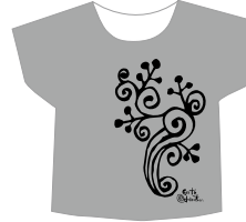
ドルマンスリーブTシャツ