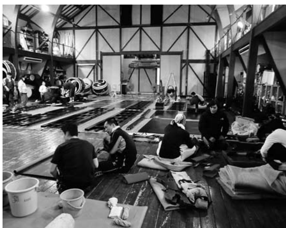
四〇六 新年度、各々のツアーや舞台を経て久々に顔を合わせた一同。演奏者を中心に、日頃の感謝を込めて楽器や舞台道具を綺麗にしようという「感謝の会」を行いました。 (写真：松田菜瑠美)