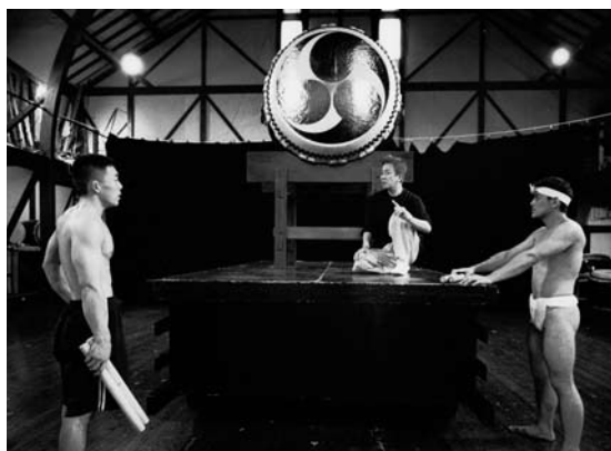
ふたりは鼓童研修所の同期生で、切磋琢磨し合うライバル同士。二〇〇三年「鼓童ワン・アース・アースペシャル」では、新人ながら直接指導を受けた、玉三郎第一期生でもある。