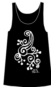
チュニックタンクトップ