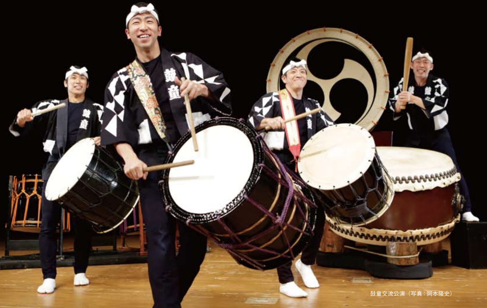
鼓童交流公演