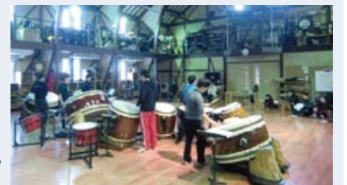
ヨーロッパツアー前の「伝説」稽古