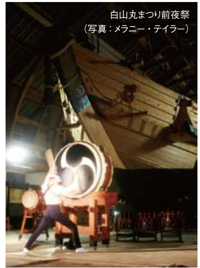
白山丸まつり前夜祭

問:佐渡国小本木民俗博物館 Tel. 0259-86-2604、白山丸友の会 Tel. 0259-86-1234