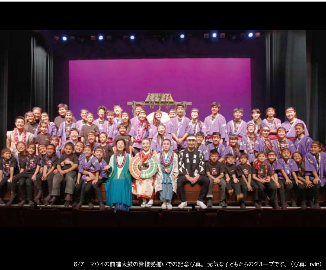
6/7 マウイの前進太鼓の皆様勢揃いで記念写真。元気な子どもたちのグループです。

する連続公演は、僕にとって初めての経験です。私は、公演の始め子どもたちの元気の高さと好奇の目に緊張していました。公演中、子どもたちは演奏に対してとても素直