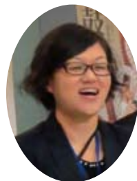
浅草便り 文●井関直美

屋を改造して仲間たちが集えるアートギャラリーを作るべく、仲間の協力を得ながら、一人でこのことと取り組まれました。そして、このギャラリーには、私と容子の共同作品が展示されることと相成りました。私の古い太鼓バチの飾り付けと作品を飾る白のパネルに、先生が三色の色を付けてくださり、三人の共同作品でもあります。ギャラリーの名前は『巨 and 麻』です。