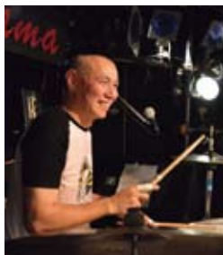
梶原徹也(かじわら・てつや)

城山コンサート最終日8月24日の「祝祭」にスペシャルゲスト・梶原徹也さんをお迎えます。ロックバンド「ザ・ブルー・ハーツ」で活躍されていた梶原さんのドラム。鼓童、BLUE TOKYO、DAZZLEとの共演で、どんな音を響かせてくれるのでしょうか？ お楽しみに。