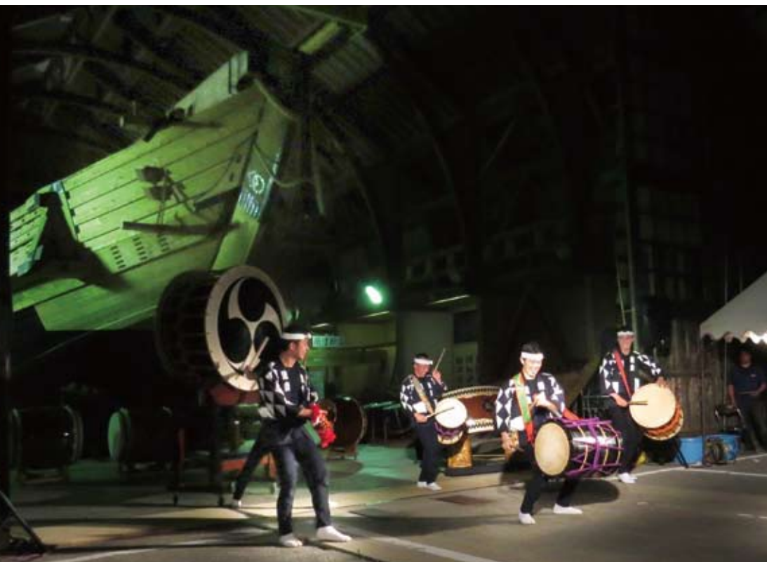
7/26「白山丸まつり」前夜祭に小編成で出演。佐渡・宿根木の木造の美しい千石船の前で演奏いたしました。

勢のお客様にご来場いただきました。皆様 ポンチョをかぶりながら歓声や口笛で会場 を盛り上げてくださいました。 二日目は昨日以上に盛り上がり、リヨン 名物の座布団投げ(非常に良かったよという ジェスチャー)が起り、客席と共に私達も大 興奮で幕を閉じることが出来ました。また フランスで公演ができる日を楽しみにしてい ます。 (報告:小田洋介)