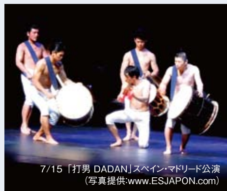
7/15 「打男 DADAN」スペイン・マドリッド公演