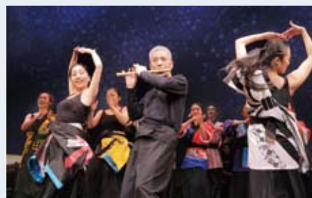
FLAMENCO 道成寺 (写真：Hiroyuki Kawashima)