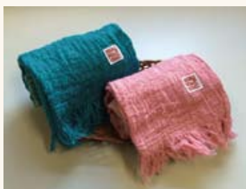
鼓童ふわりタオル