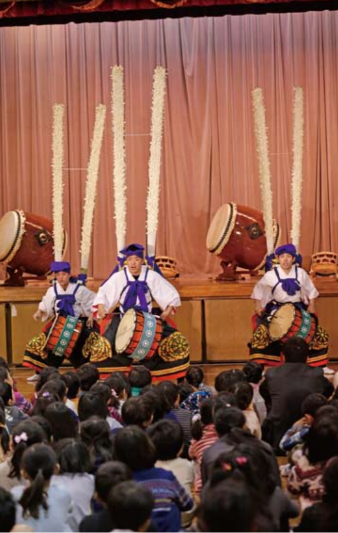
12/17 東京・文京区立湯島小学校での交流学校公演の様子。 演目「LION」の迫力に子ども達もびっくり。