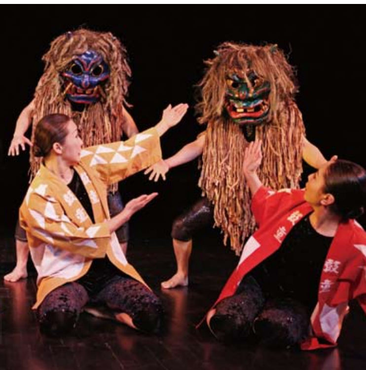
「神秘」アメリカ・ニューヨーク公演。北米版「なまはげ」ではカラフルな鼓童半纏が登場。