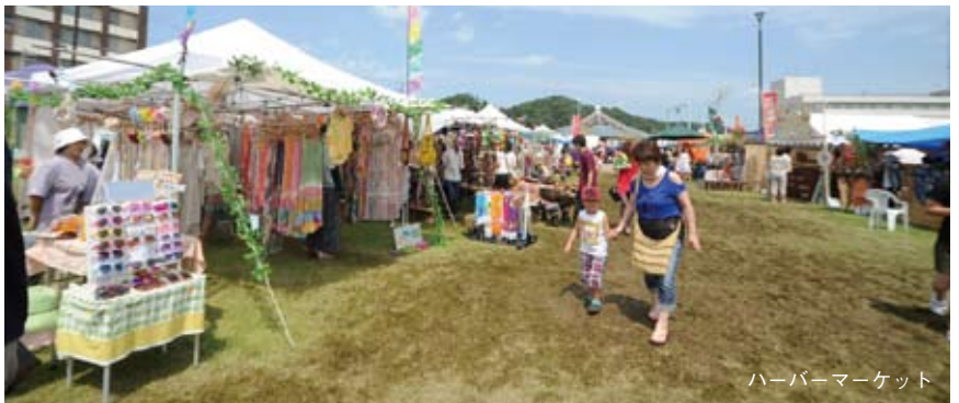
ハーバーマーケット

佐渡太鼓体験交流館(たたらこう館)を会場とし、多彩で内容の濃いプログラムを毎日開催。恒例の太鼓のワークショップ以外に、佐渡の芸能「南片辺の御太鼓」が登場するほか、バリ島の民俗文化を紹介するセミナーを予定しています。