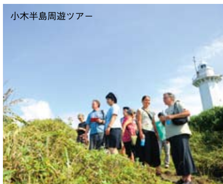
小木半島周遊ツアー