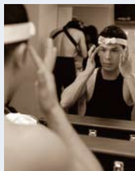
「道」公演、開演30分前