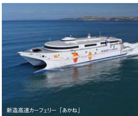
新造高速カーフェリー「あかね」