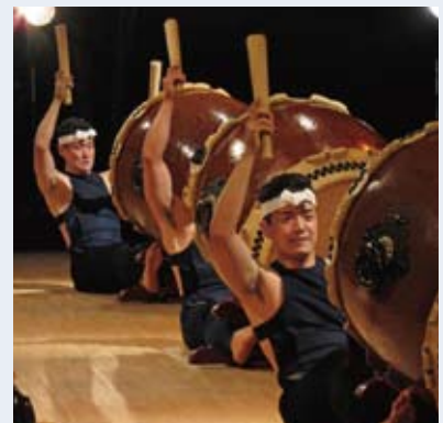
「はじめてのKODO」公演より