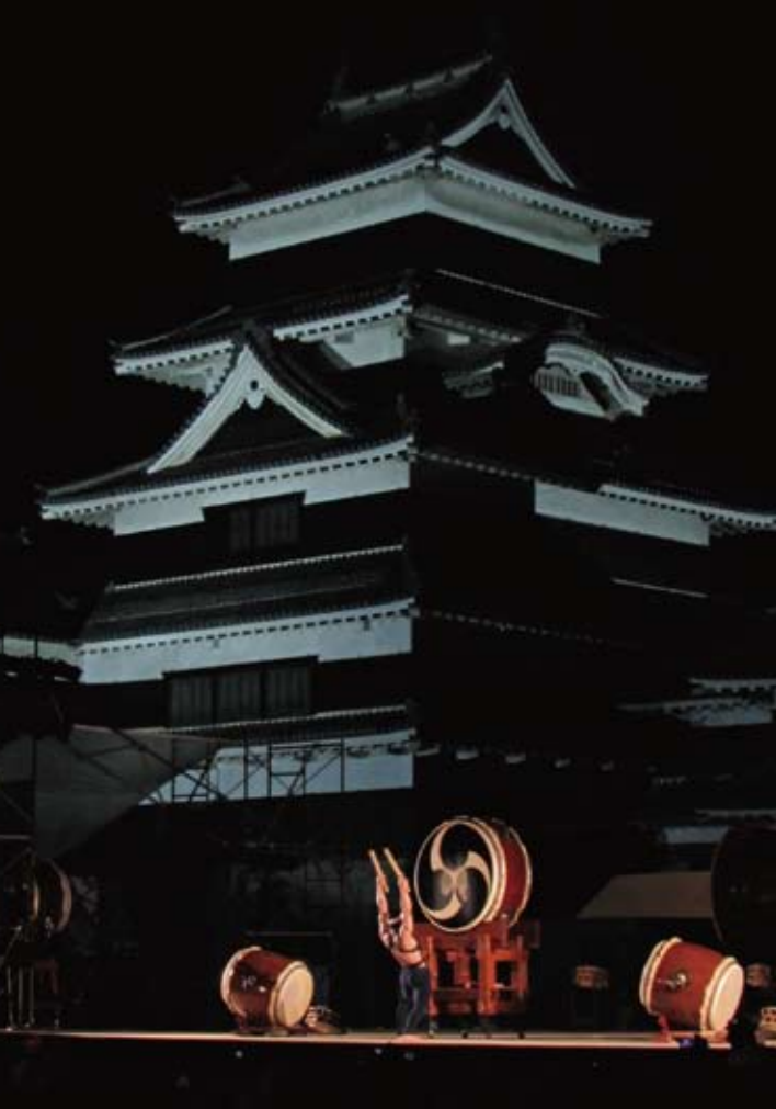
「第28回 国宝松本城 太鼓まつり」に出演。 壮観なお城をバックに2日間、トリを飾りました。

客席登場から親子の温かい雰囲気、手拍子。足も届かないイスにちよんくと座った子ども達も目をキラキラさせています。六〇分という時間は彼らにとつて短くはないはずですが、この二ヶ月間子どもたちの反応を目の当たりにしながら公演してきたメンバーの成果か、あつという間に感じられて、とても嬉しく思いました。 (報告:内田依利)