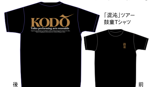
「混沌」ツアー 鼓童Tシャツ