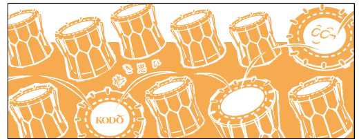
鼓童手ぬぐい「鼓童塾」