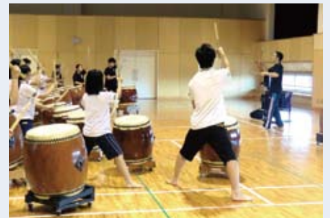
高文連30周年特別生徒講習会 鼓童ワークショップ