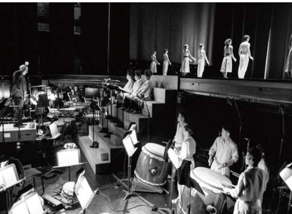
「輝夜姫 Kaguyahime: The Moon Princess」の最終リハーサルの様子。指揮はミカエル・デ・ロー氏。鼓童もオーケストラピットの中で演奏する。中央は雅楽奏者の皆さん。

十／十九 カナダ・ケベック州モントリオール 今年の十二月から学校公演の演出をしてきて感じてきたこと。それは、インターネットで世界は繋がっている、子ども達にとつてリアルな世界はまだ学校と家庭と自分の足で歩ける範囲で、それがその土地であり、国であり、この時代のような気がした。この響きを生で感じたらどんな反応をするのだろうか