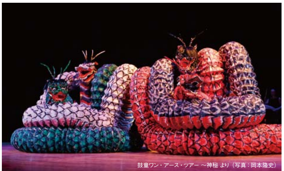
鼓童ワン・アース・ツアー～神秘より