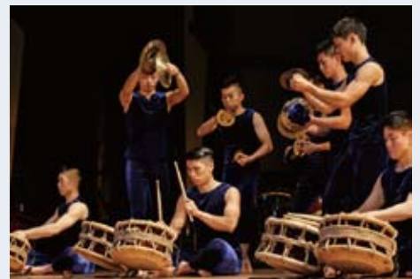
鼓童ワン・アース・ツアー～混沌 佐渡公演より「去来」