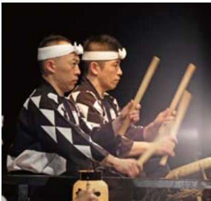
2015年3月の鼓童特別公演2015「道」より