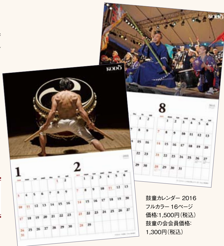
鼓童カレンダー 2016 フルカラー 16ページ 価格:1,500円(税込) 鼓童の会員価格: 1,300円(税込)

鼓童グッズのお問い合わせはこちらまで ☎ 0259-86-3630 (販売部) http://www.kodo.or.jp/store/