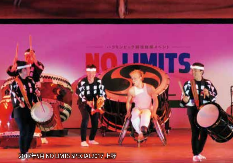
2017年5月 NO LIMITS SPECIAL2017 上野