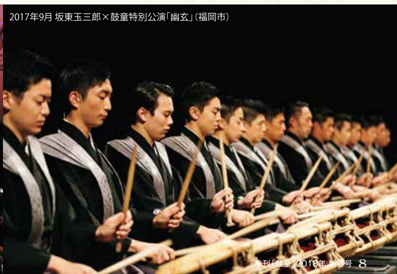
2017年9月 坂東玉三郎×鼓童特別公演「幽玄」(福岡市)