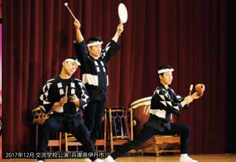
2017年12月 交流学校公演(兵庫県伊丹市)