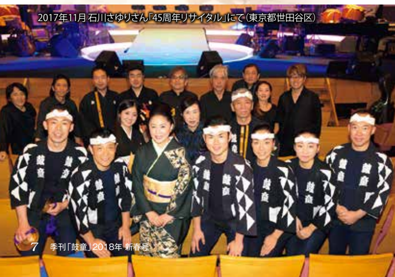
2017年11月 石川さゆりさん「45周年リサイタル」にて (東京都世田谷区)