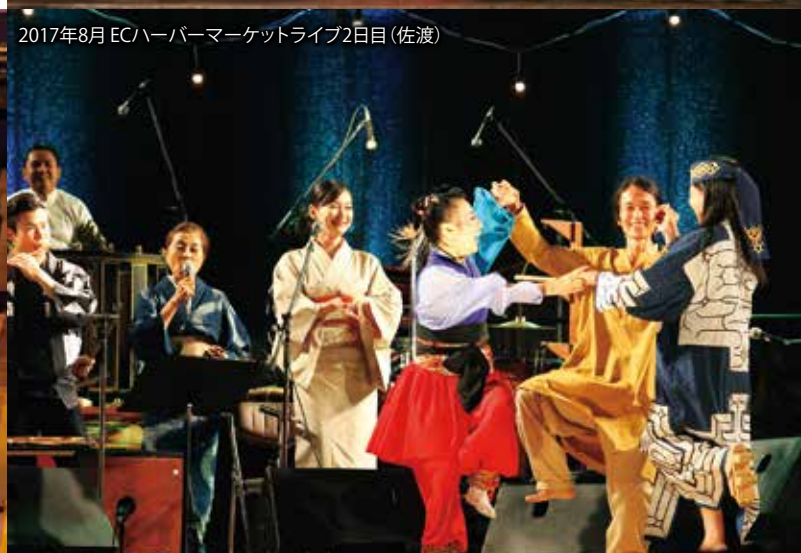
2017年8月 ECハーバーマーケットライブ2日目 (佐渡)