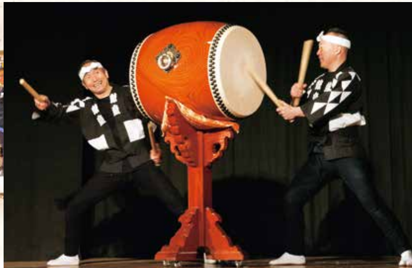
2017年4月 鼓童佐渡宿根木公演 (佐渡)