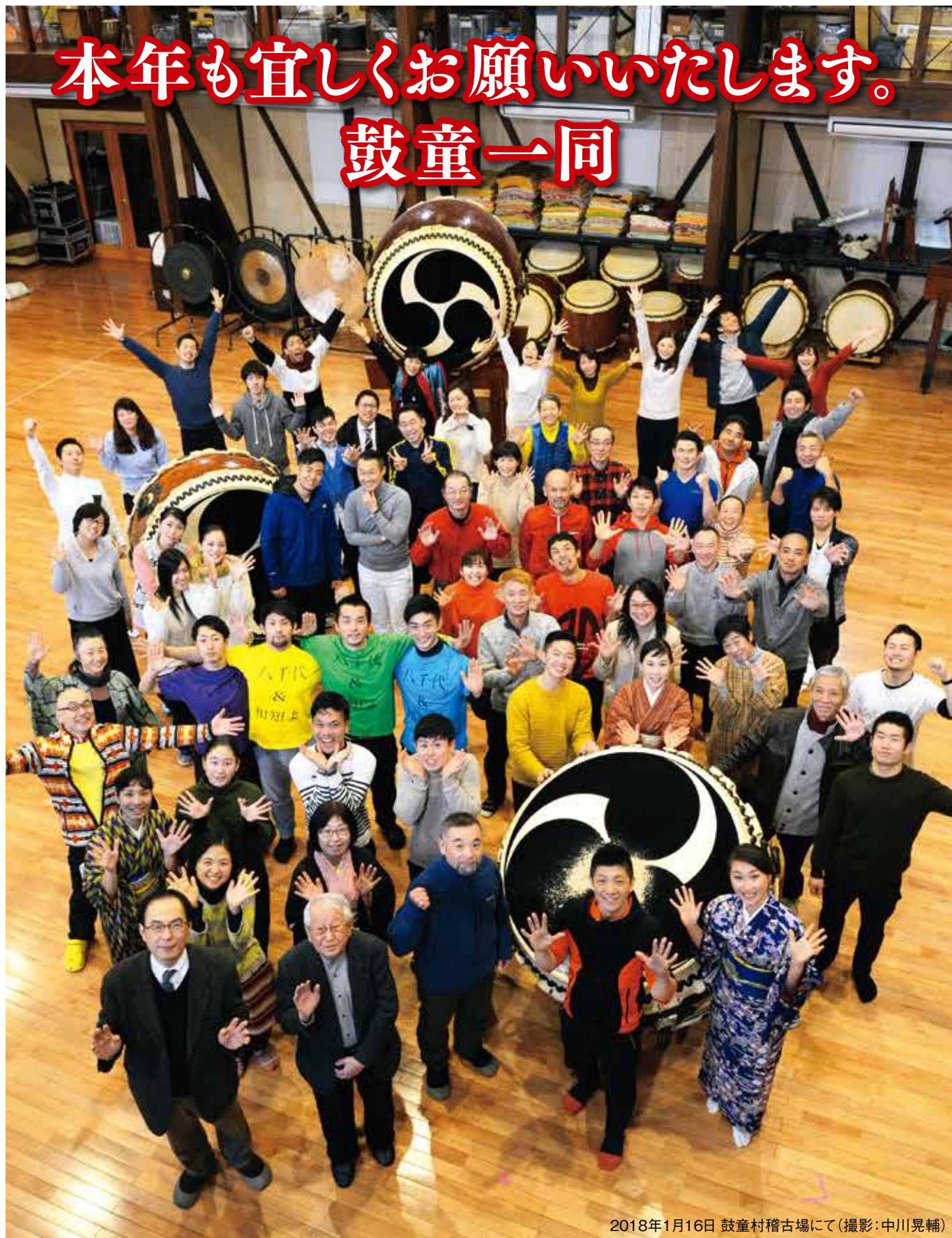
2018年1月16日 鼓童村稽古場にて

最新情報は、 ウェブサイト facebook Twitter メルマガ をご覧ください。