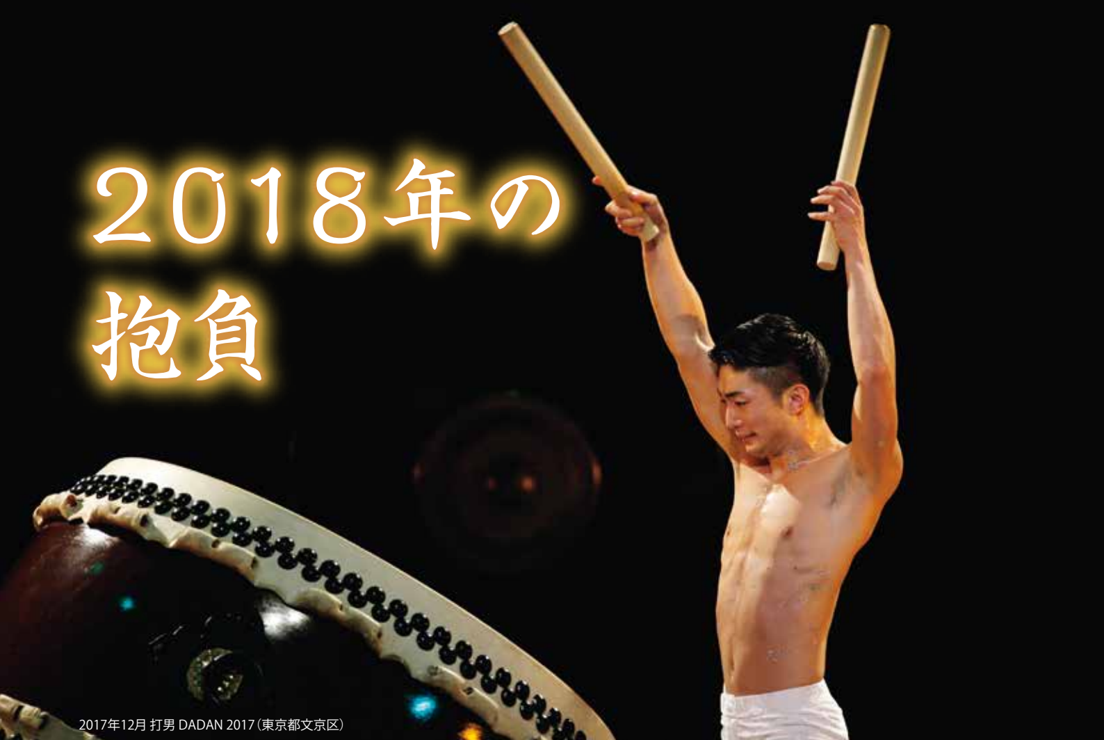
2017年12月 打男 DADAN 2017 (東京都文京区)