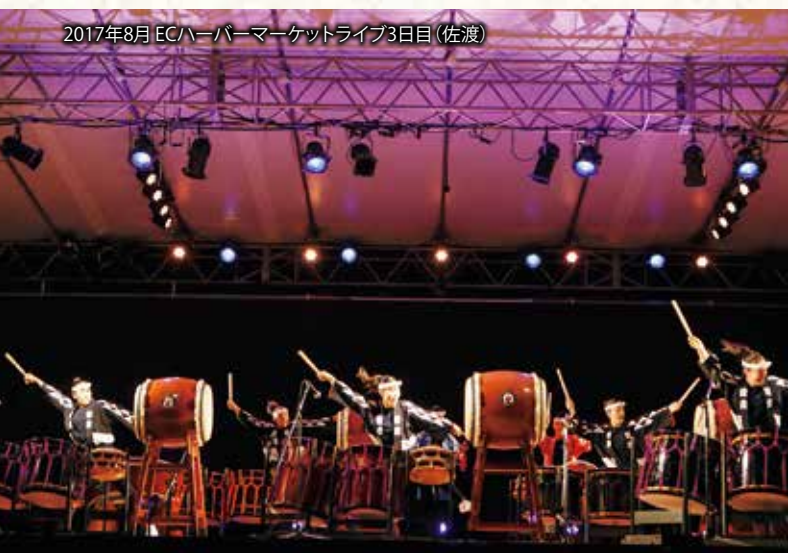
2017年8月 ECハーバーマーケットライブ3日目(佐渡)