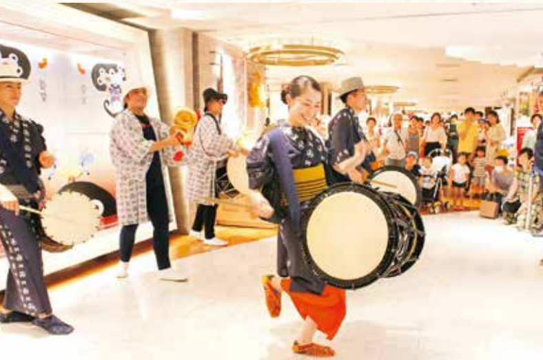
2017年7月 ISETAN BON DANCE (東京都新宿区)

自分自身への挑戦！ 自分の思い込みに気付き、固定概念を取っ払い、自分の殻を破る！