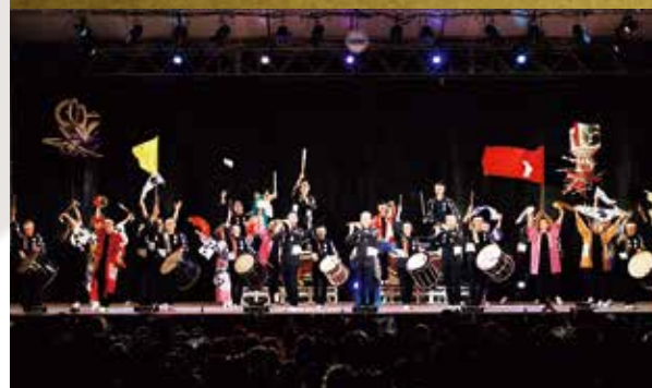
▲「鼓童オールスター スペシャルライブ」