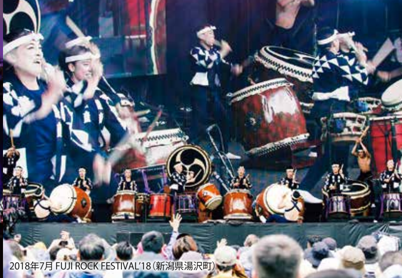
2018年7月 FUJI ROCK FESTIVAL '18 (新潟県湯沢町)