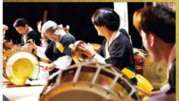
▲「金徳洙サムルノリ」