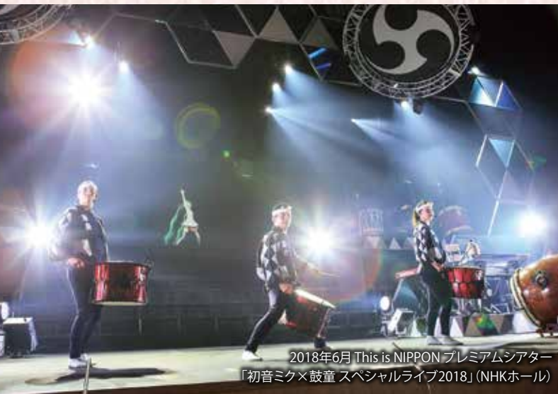
2018年6月 This is NIPPON プレミアムシアター 「初音ミク×鼓童 スペシャルライブ2018」(NHKホール)