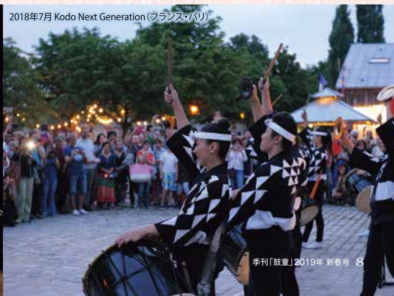
2018年7月 Kodo Next Generation (フランス・パリ)