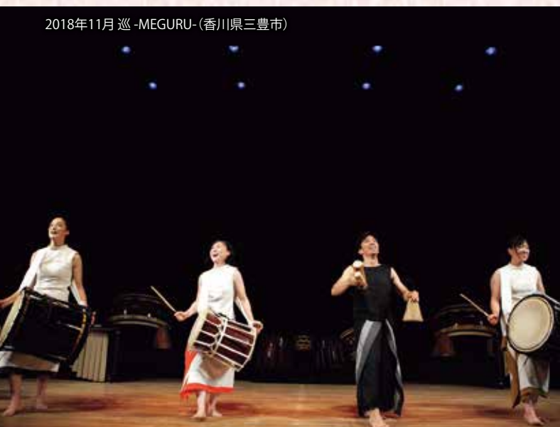
2018年11月 巡-MEGURU-(香川県三豊市)