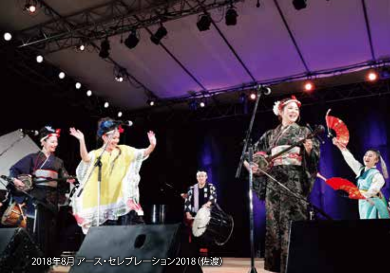
2018年8月 アース・セレブレーション2018 (佐渡)