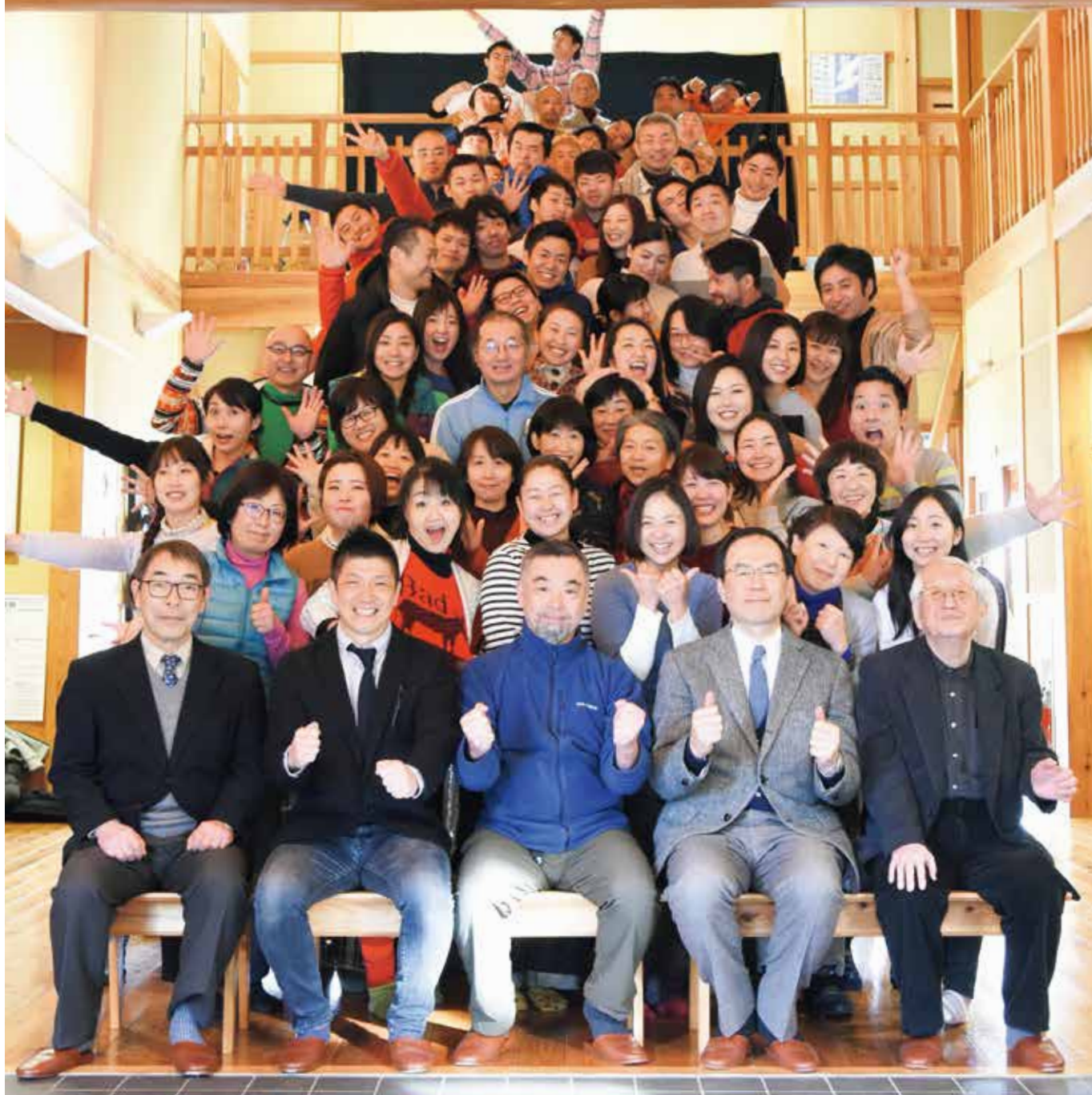
2019年1月15日 佐渡太鼓体験交流館(たたこう館)正面階段にて

最新情報は、 ウェブサイト facebook Twitter メルマガ をご覧ください。