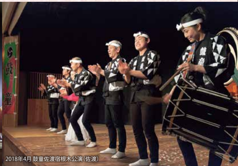
2018年4月 鼓童佐渡宿根木公演(佐渡)