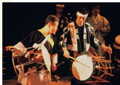
太鼓界に広がる両面打ち(通称:ダバダバ)も始まりはサムルノリとの出会いから。