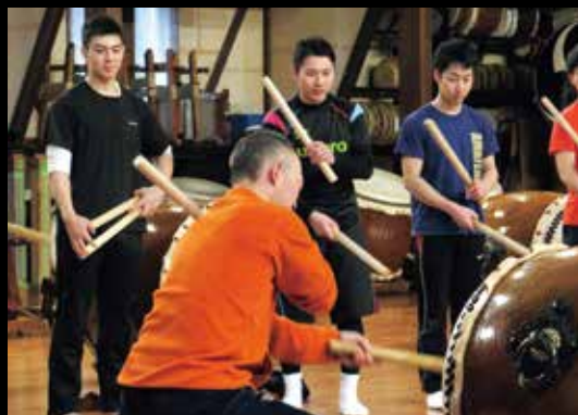
鼓童の型、鼓童の音を、伝えていく。今までとこれからを繋ぐ大切な場。

鼓童公演の時期、浅草駅を降りると、まちは鼓童の歓迎ムードに包まれている。仲見世通りや雷門通り、オレンジ通りにフラッグが並び、伝法院通りで放送が流れ、浅草ならではの短冊形のポスターが町中に貼られている。今年7年目を迎える浅草での公演は、公演メンバーや鼓童スタッフにとつても、そしてきつと浅草の方々にとつても特別な場だ。