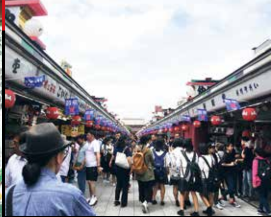
右: 仲見世通りにズラッと並ぶフラッグは圧巻。全て浅草の皆さんのご厚意によるものだ 左: 短冊形のポスターが浅草の店中に。ポスター総数は2,000枚もの数にのぼる。