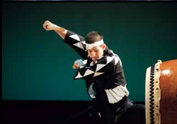
上:ベテランが長いツアーに着くのは今や貴重な機会。 中:新たな息吹が吹き込まれた鬼太鼓座時代からの代表曲「モノクローム」。 下:鼓童のDNAや血を受け継ぎ、太鼓の音をひたむきに追求していく。

若手にとつて、同じことをひたすらやり続け、モチベーションを保ち、神聖さを失わずに向き合うことも挑戦となる。「道」のような、鼓童らしい舞台は、僕らが入った時は何年間もちよつとつ変えながらずつとやってきていたもの。それを今のメンバーでより自由に、どんな演目になっても鼓童の人だと思ってもらえるように仕上げたい」(船橋)。自分の演目に何回でも同じ気持ちで向き合う。目指すのは、そこだ。