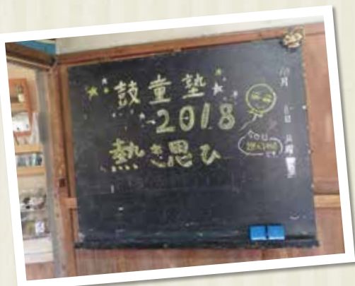
鼓童塾2018参加者募集中! 詳しくはp8をご覧ください。