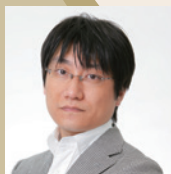
山下 康介 (作曲家)