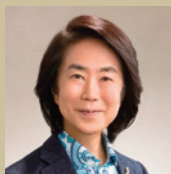
渡辺 俊幸 (審査員長/作曲家)