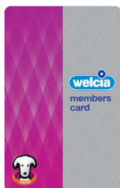
(*1) ウエルシアメンバーWAON POINTカード券面デザイン

これによりウエルシアグループ店舗では、「Tポイント」と「WAON POINT」の両方のサービスをご利用いただけることとなります。また、サービス導入に伴い、ウエルシアオリジナル券面のWAON POINTカード「ウエルシアメンバーWAON POINTカード」を発行いたします。(*1)